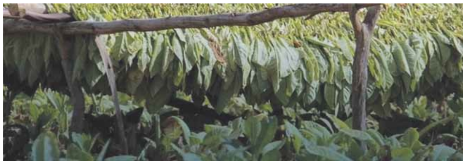
Slika 1. Listovi duhana

ćao i uzgoj. Došlo je do izgradnje duhanskih stanica u Imotskom, Vrgorcu, Dubrovniku, Sinju, Metkoviću i Splitu, a nešto kasnije u Trogiru i Drnišu. U tim je stanicama zapošljavano stručno osoblje za uzgoj duhana, dok su žene i djeca razvrstavali otkupljeni duhan (Vrzan, 2017). Proizvodnja duhana u Istri počinje tek 1923. godine u formi zadruga na području koje omeđuje Poreč, Pazin i Pulu (Bauk, 2015). Uvođenjem radničkog samoupravljanja 1951. godine, osnivaju se poduzeća za otkup i obradu duhana. Od 1954. godine, slavonski i podravski uzgajivači u suradnji sa stručnjacima zagrebačkog Duhanskog instituta počinju saditi dvije nove vrste, burley i svijetla virginia, za koje se pokazalo da im odgovara pjeskovito tlo tog područja (Vrzan, 2017). Epidemija plamenjače, koja je devastirala duhaništa u Dalmaciji i Hercegovini, rezultirala je 1960. i 1962. godine značajnim padom proizvodnje te zatvorenjem duhanskih stanica u Sinju i Drnišu. Duhanska industrija u Dalmaciji je tijekom 1970-ih postupno odumirala (Bauk, 2015).