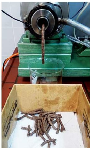
Slika 3. Izlaz pogače na glavi preše Figure 3 The output of the cake on the head of the press

Istarski duguljasti iznimno je kvalitetna konzumna sorta s krupnom jezgrom, dok Lambert i Rimski zbog svoje manje krupnoće pronalaze lakši put prema konditorskoj industriji, a sada vidimo da sadrže i nešto veći postotak ulja te uzgoj tih dviju sorata može biti proširen na druga tržišna područja.