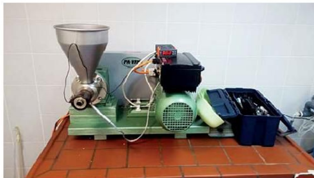
Slika 2. Pužna preša KOMET CA 59G

lješnjakovo ulje, talog i pogača. Za mjerenje količine ulja koristila se menzura, a za težinu pogače i taloga analitička vaga. Ulje je ostavljeno da se taloži još 7 dana.