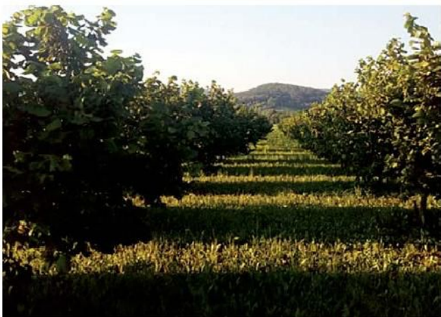
Slika 1. Nasad lijeske

Lijeska u svom prirodnom sustavu raste kao grm. U plantažnoj proizvodnji osim uzgoja u grmu u obliku vaze susrećemo još i grmoliku vazuu s niskim deblom te stablo i krošnju u obliku vaze s tri do četiri skeletne grane (Slika 1.).