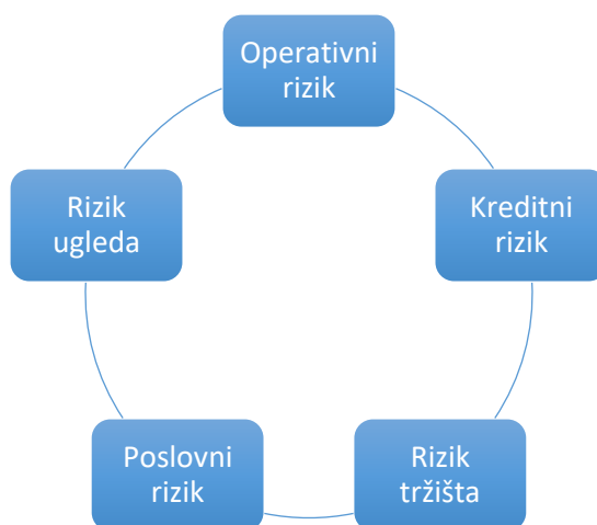
Grafikon 1. Povezanost rizika

Rizik likvidnosti temeljni je rizik kojeg određuju tržišni uvjeti nekog vrijednosnog papira odnosno bilo koje druge investicijske imovine. Rizik likvidnosti definira se kao rizik da financijska institucija neće moći nesmetano pretvarati svoja sredstva planiranom i potrebnom dinamikom. Peterlin (2004:219) definira rizik likvidnosti kao opasnost od neusklađene dospelosti sredstava i obveza prema izvorima sredstava u gospodarskom subjektu, što može rezultirati nedostatkom novčanih sredstava za podmirenje dospjelih obveza ili čak stečajem gospodarskog subjekta. Što su moguća odstupanja od očekivanih cijena manja, rizik likvidnost je veća i obrnuto, što su moguća odstupanja od očekivanih cijena veća likvidnost je manja.