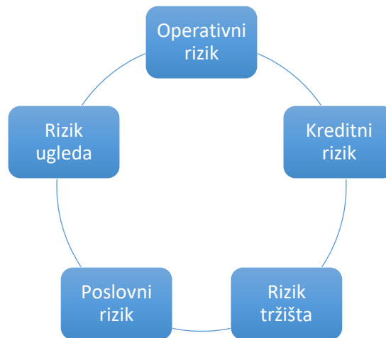
Grafikon 1. Povezanost rizika

Rizik likvidnosti temeljni je rizik kojeg određuju tržišni uvjeti nekog vrijednosnog papira odnosno bilo koje druge investicijske imovine. Rizik likvidnosti definira se kao rizik da financijska institucija neće moći nesmetano pretvarati svoja sredstva planiranom i potrebnom dinamikom. Peterlin (2004:219) definira rizik likvidnosti kao opasnost od neusklađene dospelosti sredstava i obveza prema izvorima sredstava u gospodarskom subjektu, što može rezultirati nedostatkom novčanih sredstava za podmirenje dospjelih obveza ili čak stečajem gospodarskog subjekta. Što su moguća odstupanja od očekivanih cijena manja, rizik likvidnost je veća i obrnuto, što su moguća odstupanja od očekivanih cijena veća likvidnost je manja.