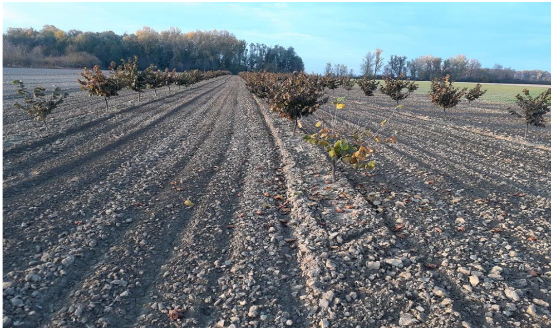
Slika 7. Nasad lijeske s prethodno opisanim sortama lijeske

Tonda Gentile delle Langhe je talijanska sorta lijeske velike bujnosti. Iako je grm, raste uspravno. Formira malo izdanaka pa se može uzgajati i kao stablašica na vlastitom korijenu. Pojedinih godina izražena je rodnost i do 38 kg po stablu. Zbog obilne rodnosti rađa alternativno. Dobrom agrotehnikom i pomotehnikom se može umanjiti alternativno rađanje što joj je inače bitan nedostatak. U Italiji se najviše uzgaja oko Latija. Cvjetanje je srednje kasno s promjenjivim karakteristikama: homogamija, proterandrija ili proteroginija. Dobar je oprašivač za većinu sorti, a nju dobro oprašuju sorte Daviana, Cosford i dr. Plodovi su srednje krupni (oko 2,8 g). Često rađa u grozdovima. U grozdu prosječno ima 2,3 ploda. Omotač je nešto duži od ploda, ljuska je tanka, svijetlokestenjaste boje i prugasta. Radman jezgre je oko 45 %. Sadrži oko 64 % masti, 17 % bjelančevina i 5,7 mg nezasićenih masnih kiselina. (Šoškić, 2006.).