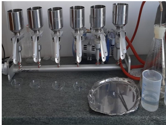
Slika 1. Mikrofiltracija uzorka otpadne vode

V - Volumen uzorka, izražava se u mililitrima