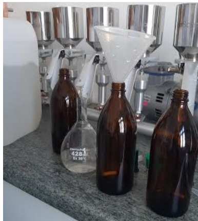
Slika 5. Ulijevanje uzoraka otpadne vode u boce za određivanje BPK 5