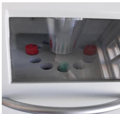
Slika 3. Zagrijavanje uzoraka u termoreaktoru