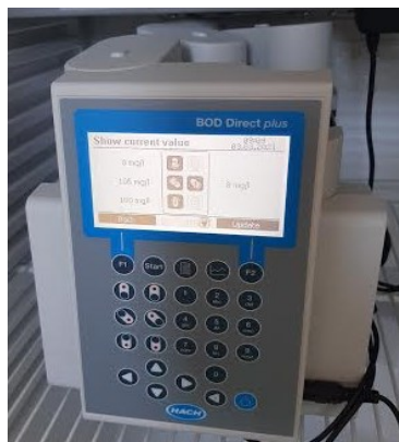
Slika 6. Magnetska ploča za određivanje BPK