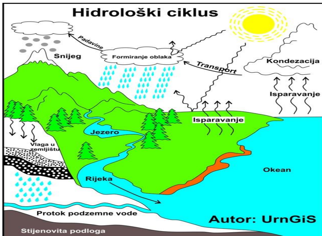
Slika 1. hidrološki ciklus vode ( geografijazasve, url )