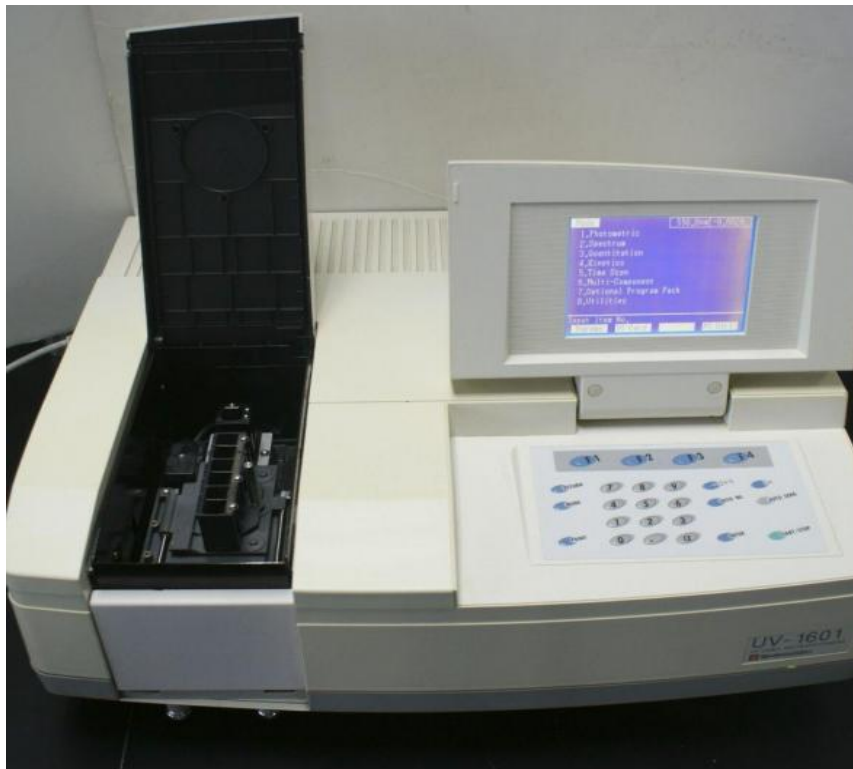
Slika 5. Uređaj SHIMADZU 1601- spektrofotometar(Bimedis, url)

Sve korištene metode su prema Radnoj uputi laboratorija Vodovod, Slavonski Brod.