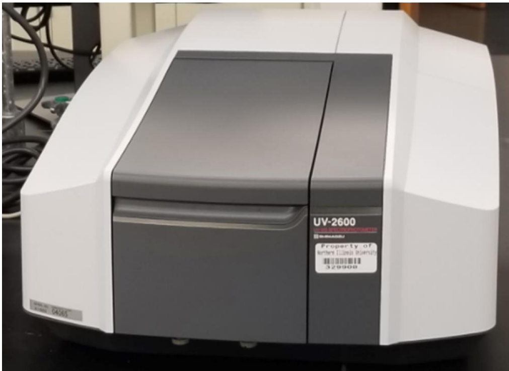
Slika 3. UV-2600 Spektrofotometar, (Tekstilno-tehnološki fakultet Zagreb, url)

Spektrofotometrija je specifičniji naziv od spektroskopije koji ne obuhvaća vremenski ovisne metode. Podrazumijeva upotrebu spektrofotometra (Slika 3), a to je fotometar (uređaj za mjerenje intenziteta svjetlosti koji može mjeriti intenzitet kao funkciju valne duljine izvora svjetlosti. Važne odlike spektrofotometra su spektralni opseg i linearni opseg apsorpcije i mjerenje refleksije (Manojlović, 2020., url).