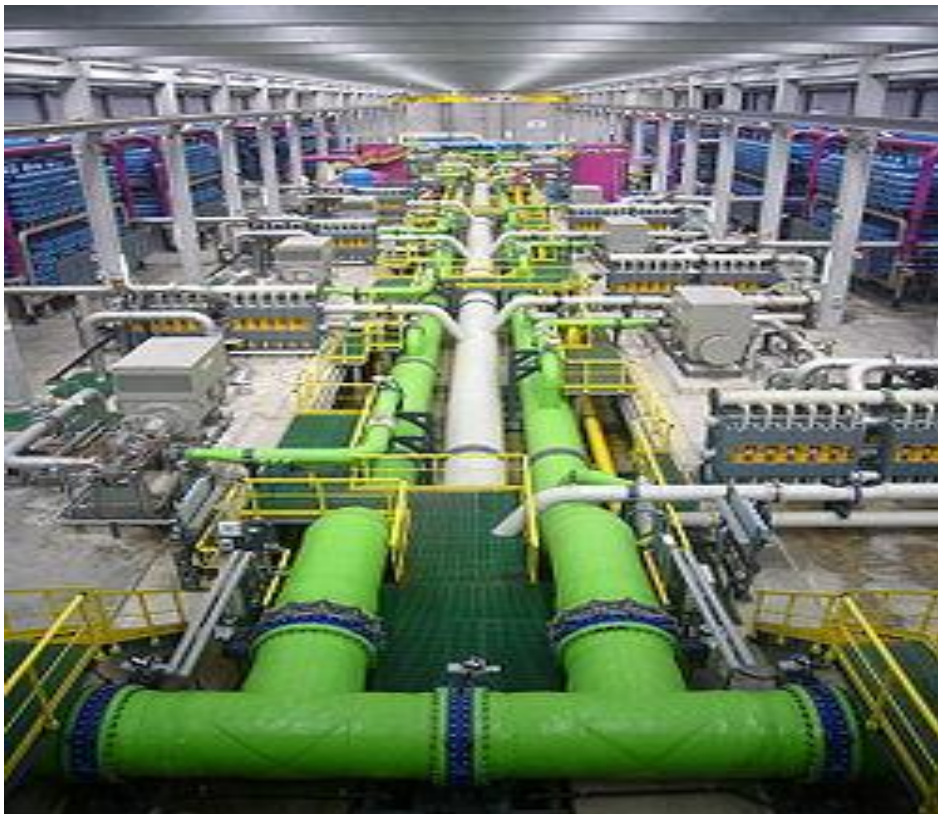
Slika 2. Uređaj za reverznu osmozu u vodoopskrbnom sustavu (Wikipedija,url)

Javna vodoopskrba (Slika 2) je opskrba vodom za više od 50 ljudi ili 10m kubnih po danu,opskrba iz objekata pravnih i fizičkih osoba koje obavljaju djelatnost poslovanja s hranom te opskrba javnih ustanova poput bolnica,škola,autobusnih te željezničkih kolodvora,ugostiteljskih objekata (wikipedija, url).