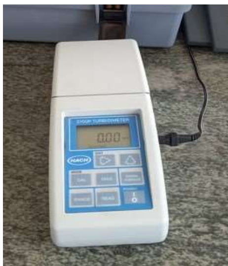
Slika 5. Turbidimetar

U kivete se dodaju uzorci vode do oznake. Zatim se kiveta stavlja u turbidimetar i očitavaju se rezultati (Arhiva Zavoda za javno zdravstvo).