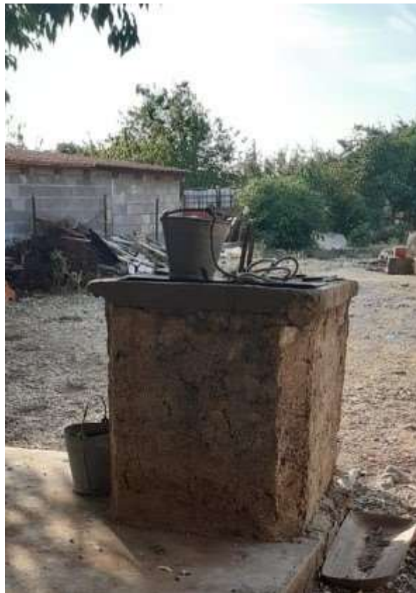
Slika 2. Bunar u Čistoj Veliki

Kišnica je voda u kojoj se ne nalaze površinska ili podzemna voda. Koriste se za opskrbljivanje jednog ili više kućanstava vodom, a ne često se na takvom vodozahvatu temelji vodovodni sustav manjih naselja. Vodonakupne površine i cisterne su sastavni dio čija je svrha da prikupljaju kišu. Izgrađene su od nepropusnog i mekog materijala, zbog čega se vrlo često grade od kamenih ploča ili betona. Ploha napukne površine nagnuta je tako da se prikupljena voda ulijeva u cisternu. U slučaju da se nakupna površina nalazi na povišenom terenu, te da bi se zabranio pristup životinjama mora biti ograđeno. Najčešće nakupne površine služe kao krovovi gospodarskih ili stambenih zgrada. Cisterna je građevina koja služi za skladištenje oborinske vode koja dotječe s nakupne površine tijekom kiše (Mayer, 2004).