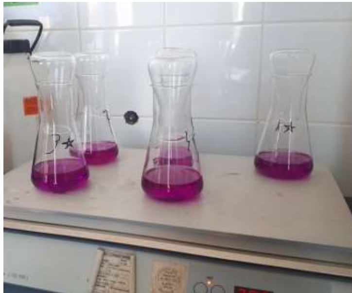
Slika 7. Određivanje kalijevog permanganata

U Erlenmayerovu tikvicu doda se 100 ml uzorka i 5 ml sumporne kiseline. Erlenmayerova tikvice se poklope manjim tikvicama kako bi se napravilo povratno hladilo i čeka se da proključa. Kada proključa doda se 15 ml kalijevog permanganata i dolazi do ljubičastog obojenja. Uzorak se ponovno zagrijava i kada proključa kuha se još 10 minuta. Doda se 15 ml oksalne kiseline koja obezboji uzorak. Ponovno se titrira s kalijevim permanganatom do pojave ružičaste boje (Arhiva Zavoda za javno zdravstvo):