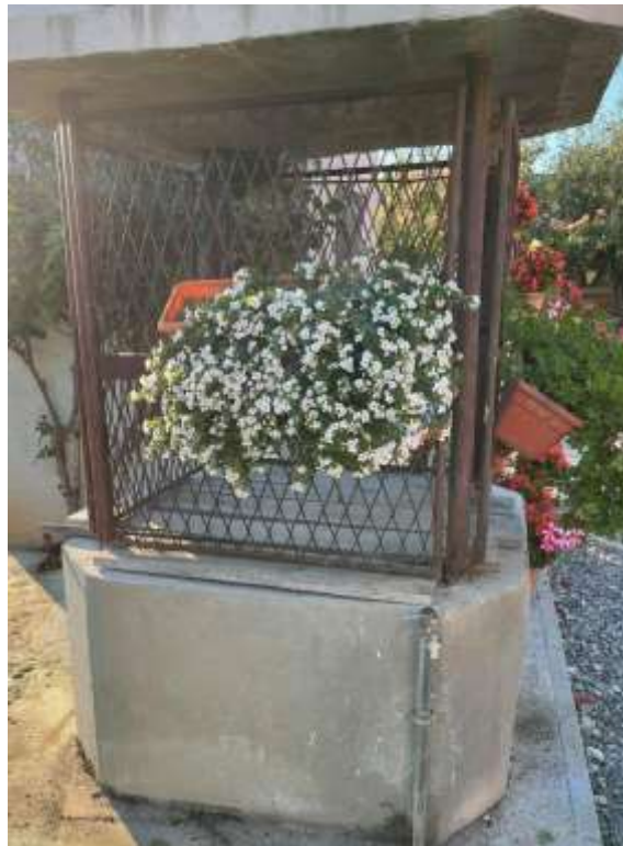
Slika 1. Bunar u Alilovcima

Bunar je duboka pregrađena jama u koju se hvata podzemna voda. U nekim područjima on je iznutra izgrađen kamenom ili opekom, a nadzemni dio je u obliku prizme, kocke ili valjka. Vodu iz bunara crpi se posudom koja je ovješena na užu. Uža je namotano na položeni vitao koji se pokreće kolom, najčešće takvi bunari budi i natkriveni. U nekim krajevima Hrvatske uža je pričvršćeno za đeram što je dugačko pokretna greda složena u visoki stup. Bunari se nalaze najčešće u zasebnim kućanstvima, dok u onim starim selima postoje zajednički selski bunari koji su ujedno bili mjesto okupljanja. Danas postoje gradski bunari koji često mogu biti umjetničko oblikovani (Enciklopedija, url).