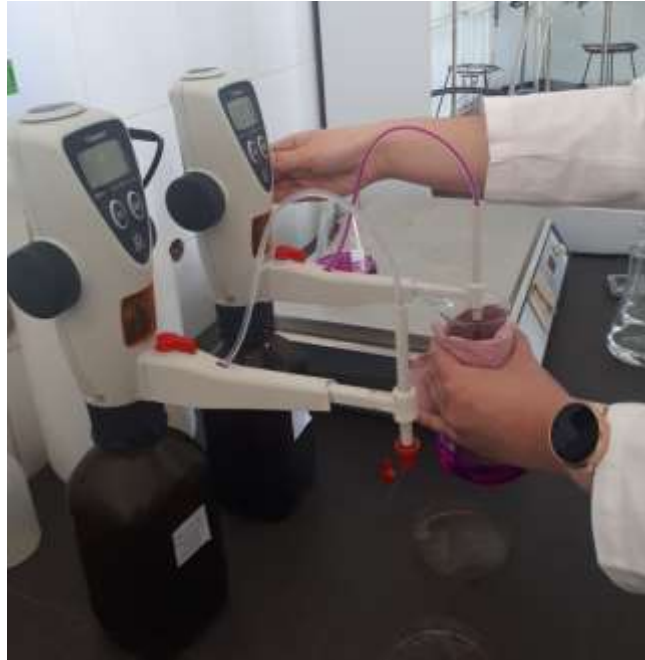
Slika 3. Određivanje kalijevog permanganata

Kalijev permanganat je jako oksidacijsko sredstvo. Brzo oksidira razne anorganske i organske tvari. Produkti redukcije kalijevog permanganata ovise o uvjetima pod kojima reakcija prolazi. Kalijev permanganat je tamno ljubičaste boje. Ovisno o koncentraciji kada je otopljen u vodi daje otopinu od blijedo ružičaste do duboke ljubičaste nijanse. Kalijev permanganat se najbolje otapa u vreloj vodi. Kristali tvari ili visoko koncentrirana otopina u slučaju da dođe u kontakt s kožom ili sluznicom, može uzrokovati opekline (Sciencedevices, url).