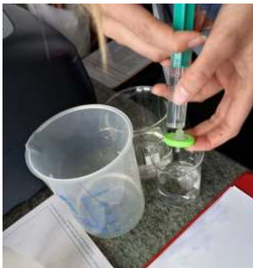
Slika 4. Određivanje boje

ponovno se napuni uzorkom. Kiveta se stavi u spektrofotometar i očita se vrijednost (Arhiva Zavoda za javno zdravstvo).