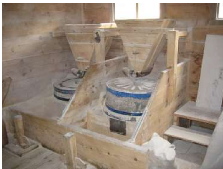
Slika 3. Mljevenje pšenice

Prije samog postupka mljevenja potrebno je provesti postupak kondicioniranja pšeničnog zrna. To je postupak dodavanja vode u pšenicu i njezino odležavanje. Ovim postupkom omotač zrna postaje žilav, a jezgra zrna mekša. U endospermu nastaju mikropukotine djelovanjem vode, čime se mijenja struktura i jezgra omekšava. Staklava zrna tvrdih pšenica