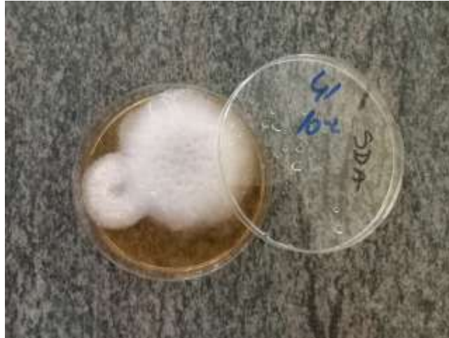
Slika 9. Porast plijesni nakon 5 dana