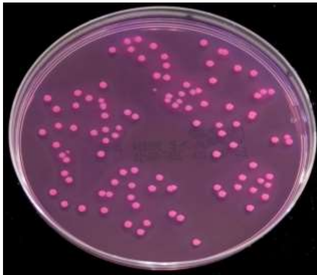
Slika 6. Enterobacteriaceae

Bakterije iz porodice Enterobacteriaceae su gram-negativni, uglavnom pokretni štapići, ne stvaraju spore, a u odnosu na kisik pripadaju fakultativnim anaerobima. Porodica Enterobacteriaceae obuhvaća veliki broj vrsta, ali samo 25 vrsta može uzrokovati bolesti. Najvažnije vrste su Salmonella i Shigella , koje uzrokuju dijareju, dok ostale vrste su uzročnici različitih bolesti kod osoba slabijeg imuniteta ili uzrokuju bolesti izvan probavnog sustava. Enterobakterije rastu na različitim hranjivim podlogama (Kalenić i Mlinarić-Missoni, 1995).