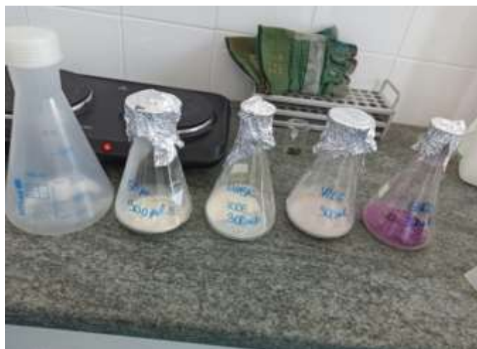
Slika 7. Priprema hranjivih podloga