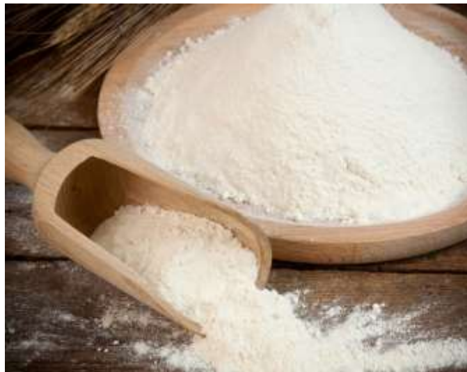
Slika 4. Brašno (Mlinoklas, url)

Mlinski proizvodi, bilo zapakirani ili u rasutom stanju, moraju odgovarati sljedećim zahtjevima kakvoće: