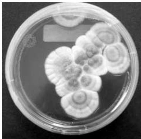
Slika 5. Plijesni (Enciklopedija, url)

Plijesni uzrokuju bolesti koje se nazivaju mikotoksikoze. Najčešći mikotoksin je aflatoksin kojeg luče plijesni roda Aspergillus i Penicillium . Njihova količina na žitaricama i proizvodima od žitarica se smanjuje u prisutnosti drugih mikroorganizama. Izrazito su nestabilni spojevi, te sredstva za bijeljenje brašna, poput klor-dioksida, klora, borata, vodikovog peroksida i drugih, smanjuju značajno njihovu količinu u brašnu. Osim aflatoksina, štetni produkti metabolizma plijesni su i okratoksin, citrinin, patulin, penicilinska kiselina i drugi. Najčešće izazivaju oštećenja jetre, bubrega i tumore, te je zbog toga izrazito važno provoditi provjeru kvalitete sirovina i gotovih proizvoda (Kljusurić, 2000).