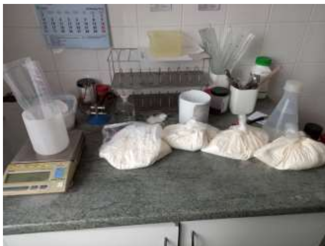
Slika 8. Priprema uzorka