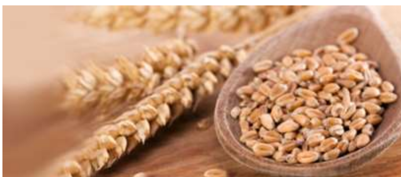
Slika 1. Pšenica (Podravka, url)

Brašna dobivena mljevenjem mekih pšenica upotrebljavaju se za proizvodnju kruha, u konditorskoj industriji, te pri proizvodnji tjestenine. Zbog meke strukture zrna, brašno patuljaste pšenice ima niži sadržaj proteina i ono se koristi za proizvodnju kolača, lisnatog tijesta i vafla.