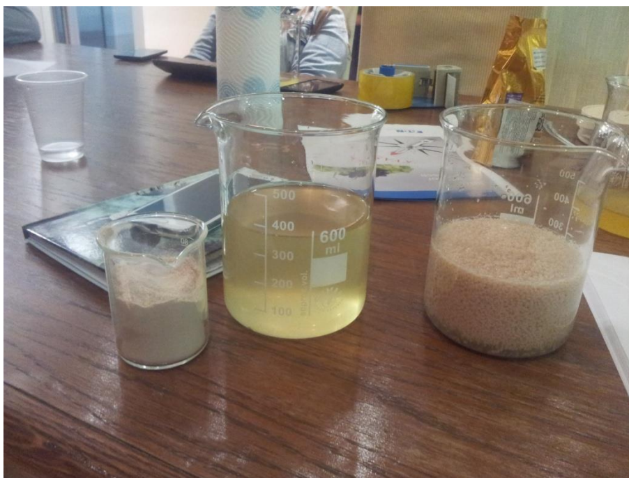
Slika 1 Priprema kvasaca Anchor Exotics

vodu). Pa tako se na 100 l budućeg mošta pripremi 20 do 30 g selekcioniranog vinskog kvasaca i doda ga se u trostruku količinu mlake (35 do 37°C) vode i ostavi 15 do 30 minuta (ne dulje). Tako se rehidrirani kvasac zatim stavlja u ranije pripremljeni i ohlađeni mošt u trajanju od 6 do 24 sata da se razmnoži. Pripremljen i razmnožen kvasac raspoređi se po bačvama. Treba napomenuti da se bačve s moštom pune do 4/5 volumena bačve, kako uslijed vrenja ne bi došlo do prelijevanja mošta iz bačve (vinogradarstvo.com, 23.8.2016.).