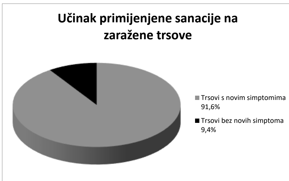
Grafikon 3. Učinak mjera sanacije

Grafikonom 3. prikazani su rezultati učinka sanacijskih mjera na 500 promatranih zaraženih trsova iz čega je vidljivo da 9,4% (47) tretiranih trsova ne pokazuje nove simptome zaraze dok 91,6% (453 trsa) pokazuje vidljive simptome zaraze odnosno novo zaraženo tkivo. Nakon sanacijskih mjera vizualnom procjenom pojave karakterističnih simptoma na 453 zaražena trsa više od 50% trsova pokazuje smanjeni porast tumornih izraslina uz malobrojne iznimke koje usprkos sanaciji ne pokazuju znakove smanjenja zaraze. Tijekom istraživanja nije provedeno detaljnije praćenje uroda grožđa obzirom je količina uroda ovisna i od ostalim čimbenicima uzgoja, iako na pokusnim trsovima vizualno nije primjetan manjak uroda grožđa bolesnih trsova u usporedbi sa zdravim.