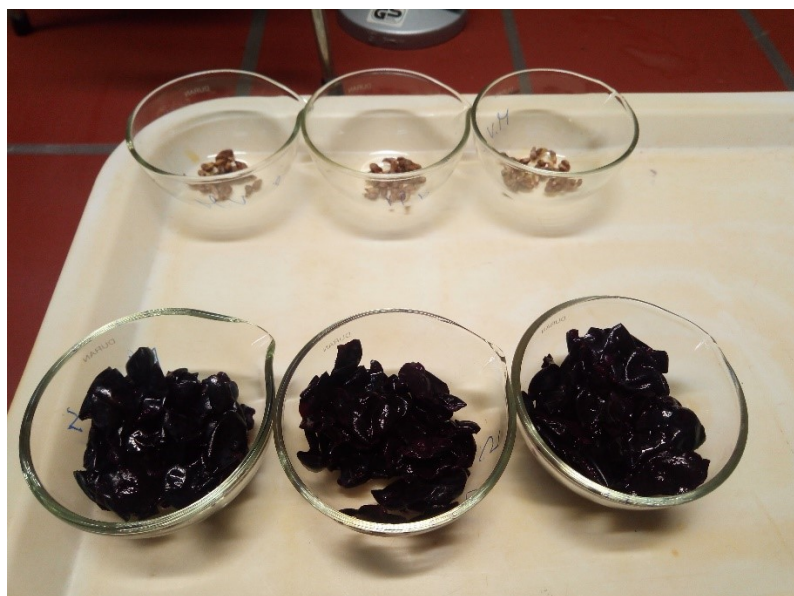
Slika 14 100 komada sjemenki i kožica pripremljene za sušenje u sušioniku