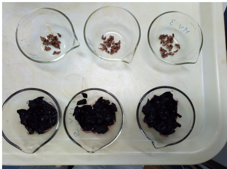
Slika 16 20 komada sjemenki i kožica nakon prešanja