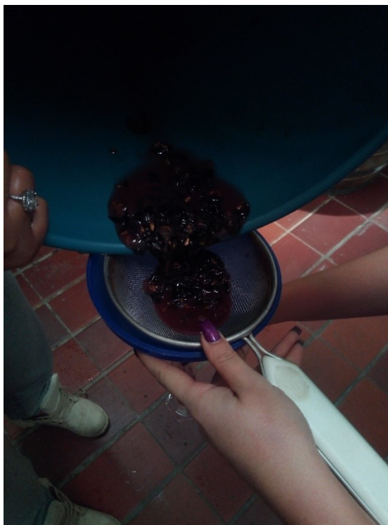
Slika 7 Cijeđenje soka od grožđa