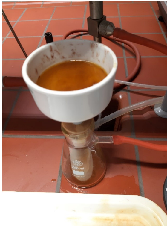
Slika 18 Filtracije kroz vakuum filter