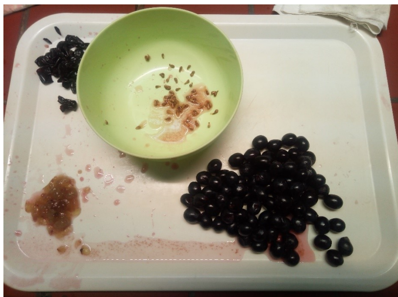
Slika 13 Odvojene sjemenke i kožice grožđa