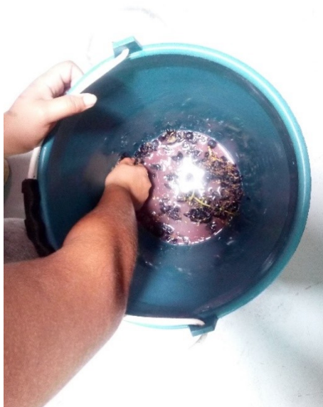
Slika 6 Gnječenje grožđa (Vlastiti izvor)