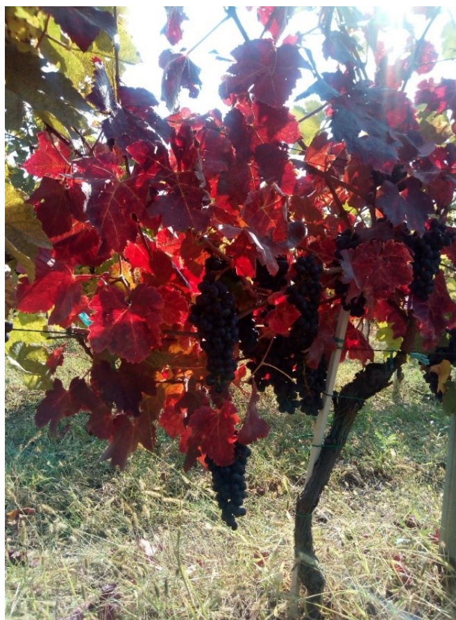
Slika 1 Odabir reda