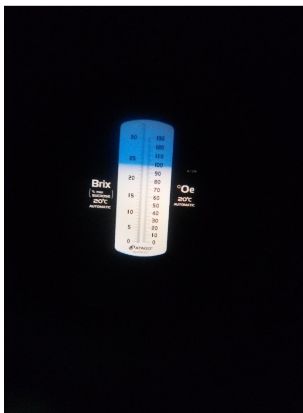
Slika 9 Skala u refraktometru

Kiselina u grožđu je bila 7,3 g/L, a šećer u grožđu je bio 99°Oe.