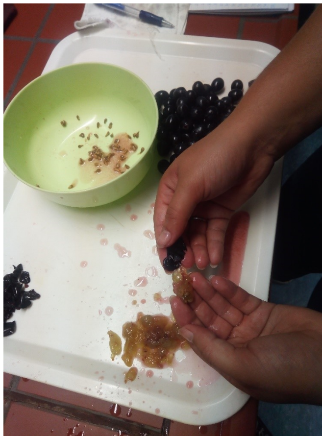
Slika 12 Odvajanje sjemenki i kožice