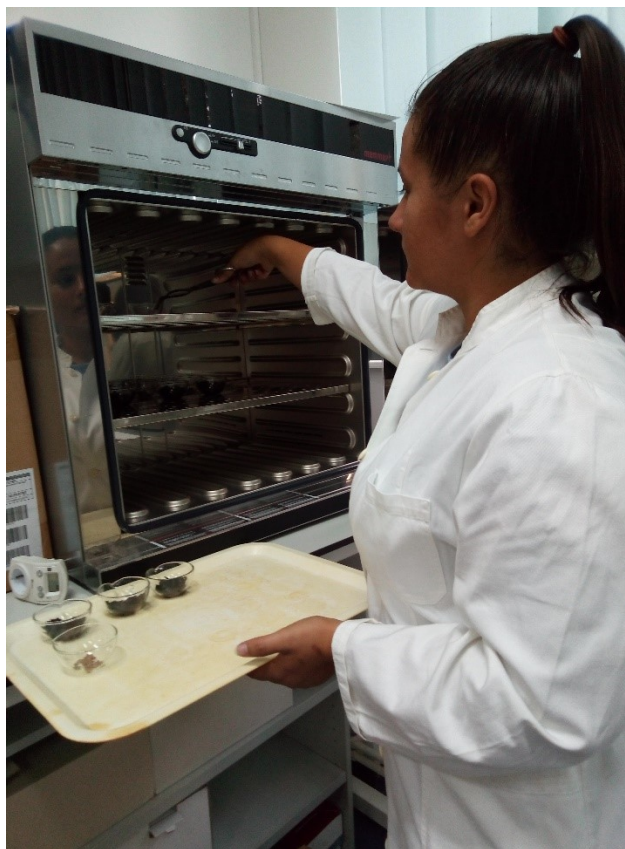
Slika 15 Stavljanje uzoraka u sušionik

Iz tablice možemo očitati da je nakon sušenja kožica u sušioniku iz prvog uzorka isparilo 66% vlage, drugog 65% vlage, a trećeg 56% vlage.