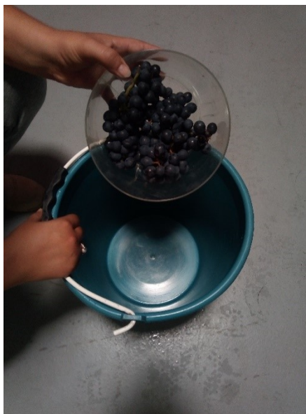
Slika 5 Grožđe za uzimanje uzorka kiseline i šećera

Nakon uzimanja uzoraka izvršilo se mjerenje kiselina i šećer u grožđu, grožđe se rukama zgnječilo tako da je izašao sok iz grožđa, te se je precijedio i pomoću refraktometra se izmjeri šećer u grožđu.