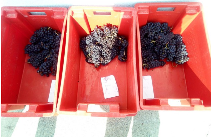
Slika 4 Tri uzorka po 10 komada grožđa