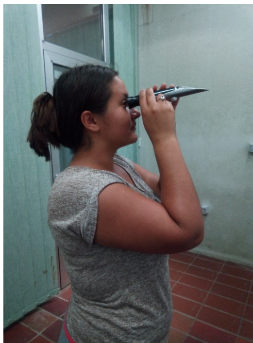
Slika 8 Mjerenje šećera refraktometrom