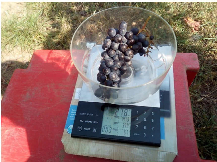
Slika 3 Težina jednog grozda