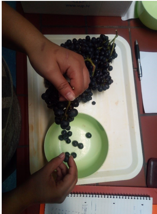
Slika 10 Odvajanje bobica od peteljke