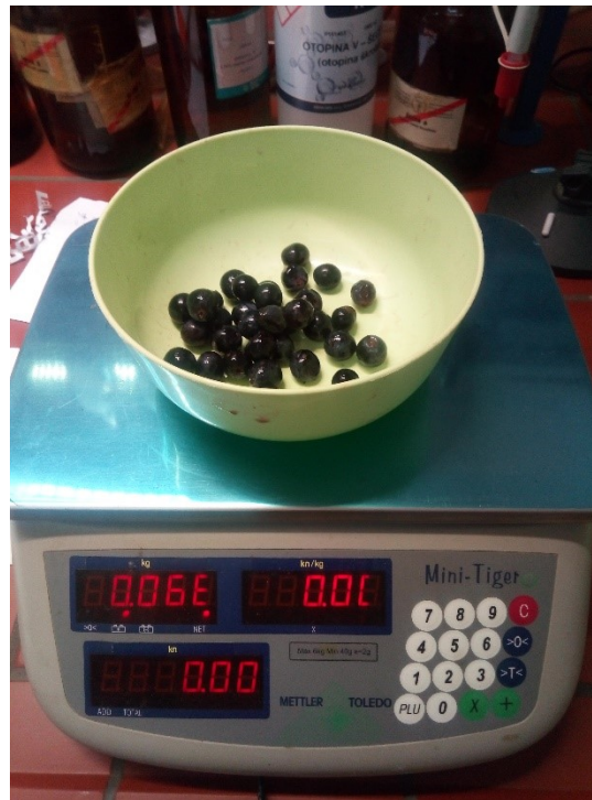
Slika 11 Masa 33 bobica (Vlastiti izvor)