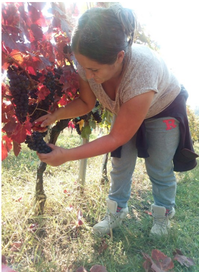
Slika 2 Uzimanje uzoraka

Uzorak je uziman ručno i nakon svakog uzimanja se izbrojalo koliko je grozdova još ostalo na trsu, te je tako kod prvog uzorka ostalo 5 grozdova, na drugom 7 grozdova, a na trećem 8 grozdova na trsu.