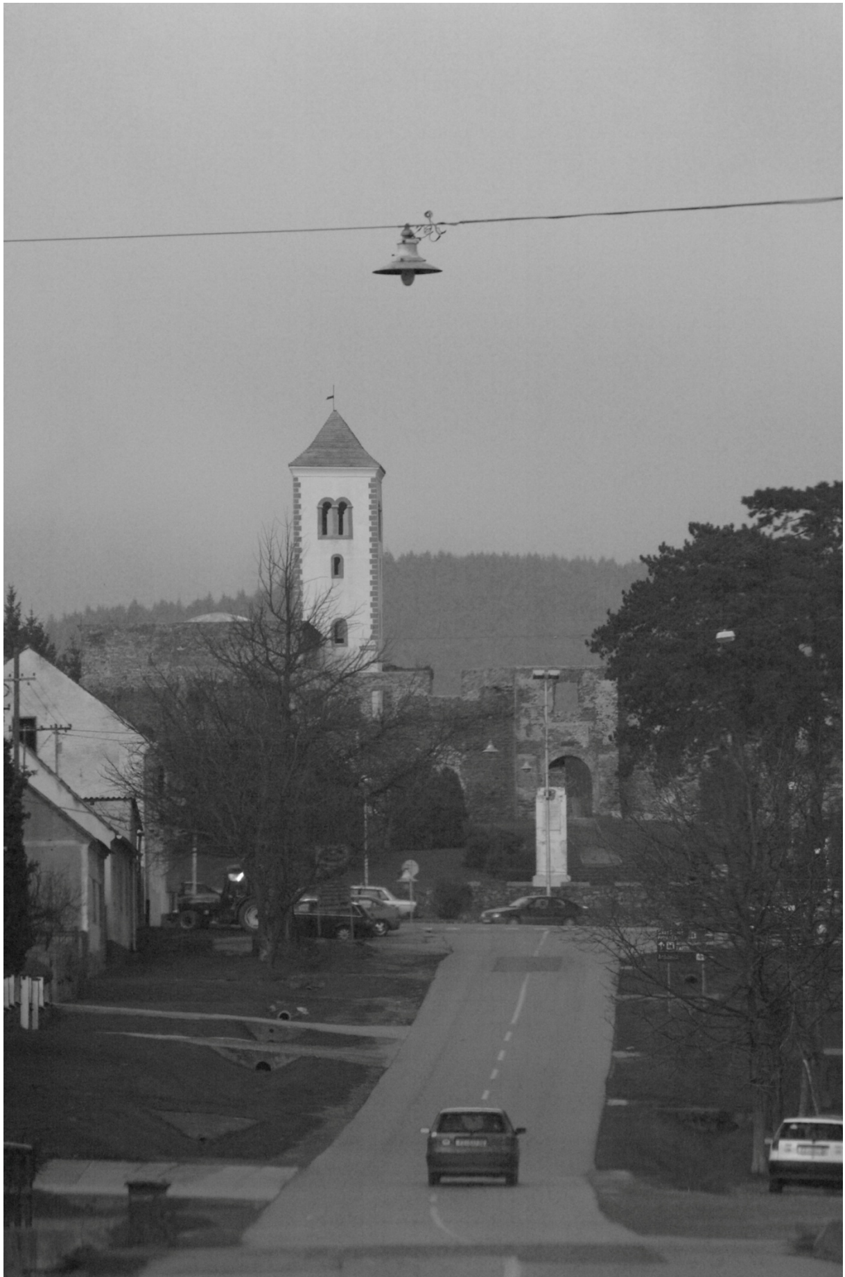
Photo 099. Castle in Kaptol / Dvorac u Kaptolu