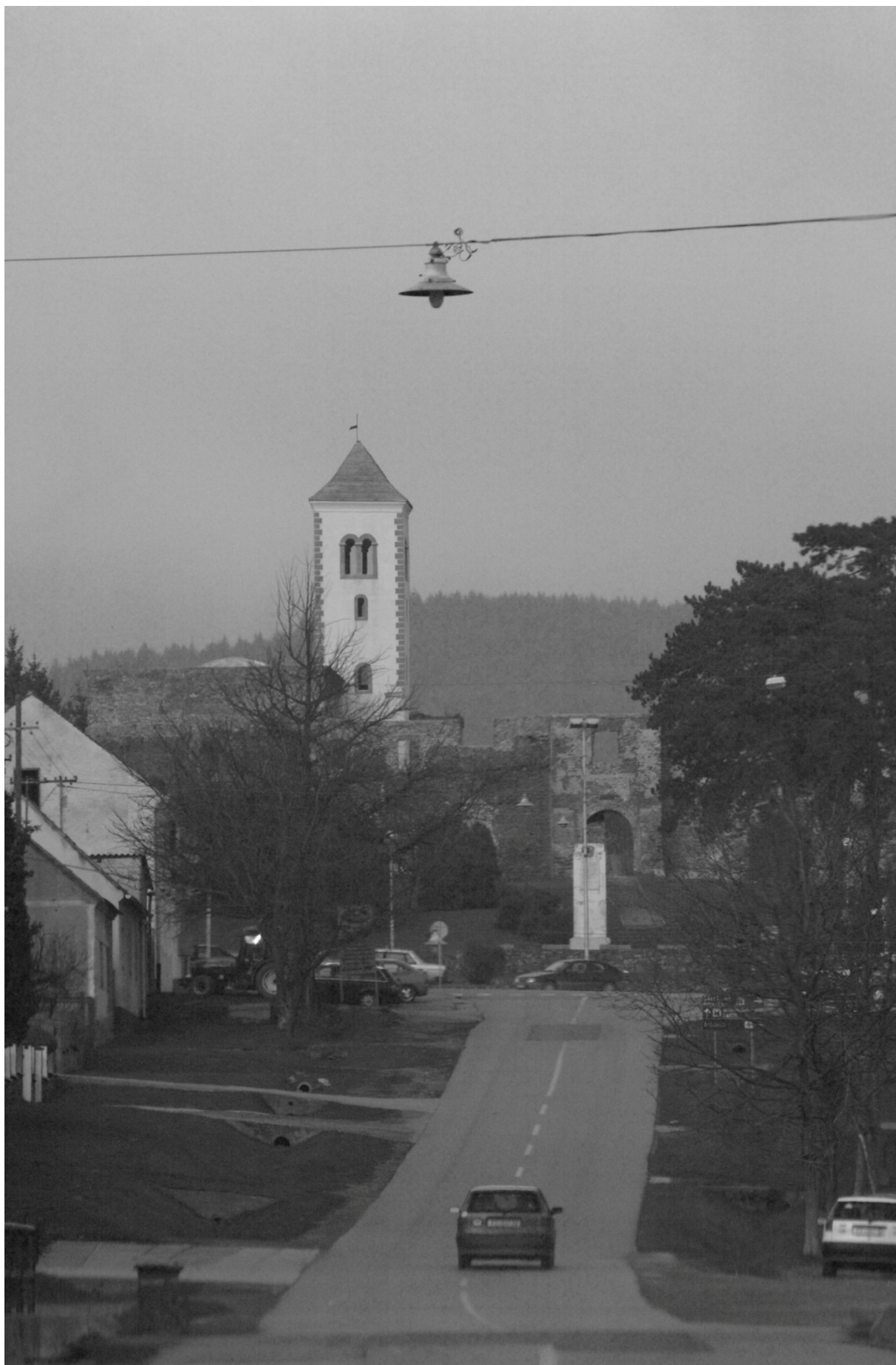
Photo 099. Castle in Kaptol / Dvorac u Kaptolu