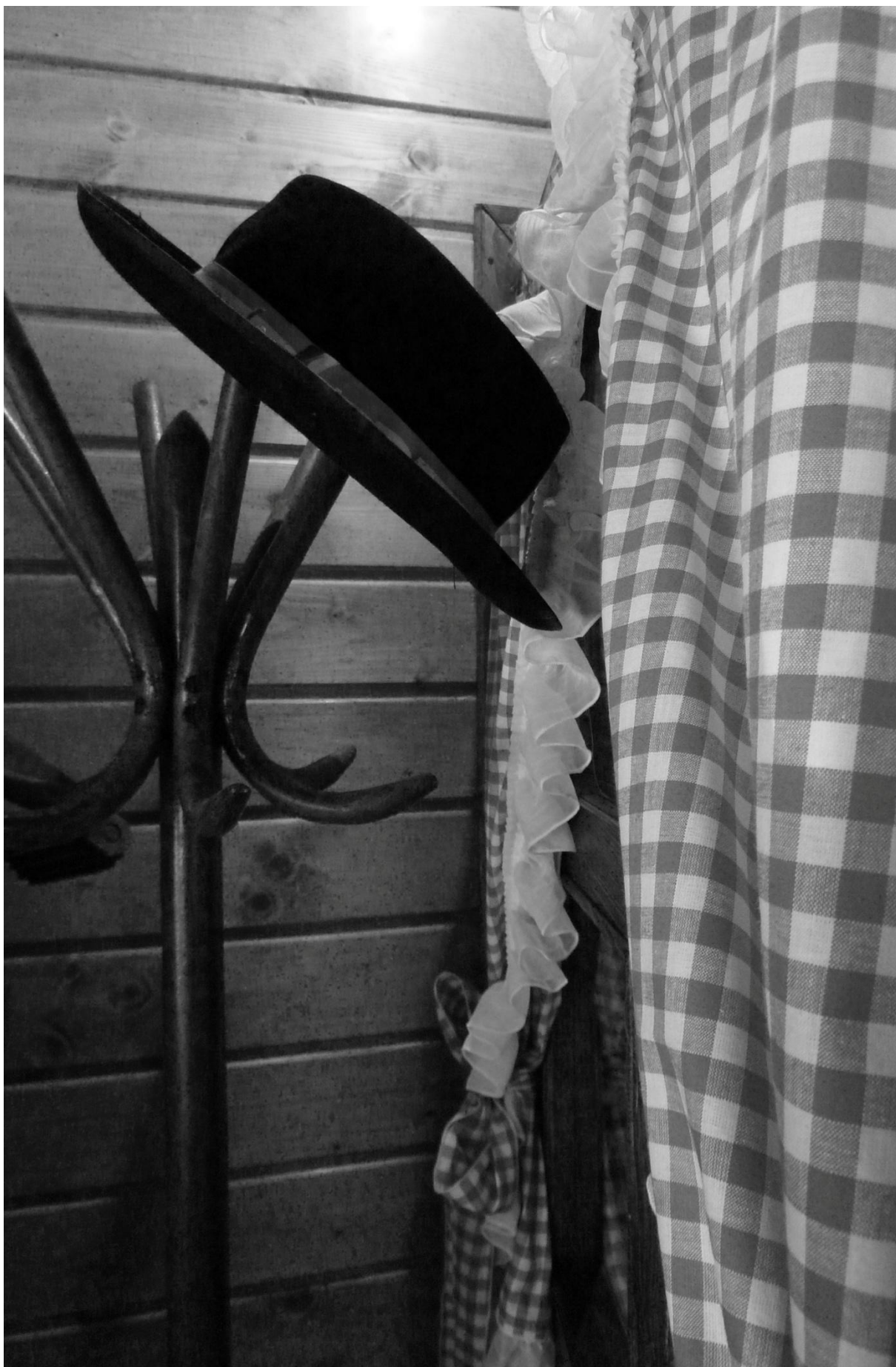
Photo 130. Slavonian hat / Slavonski šešir