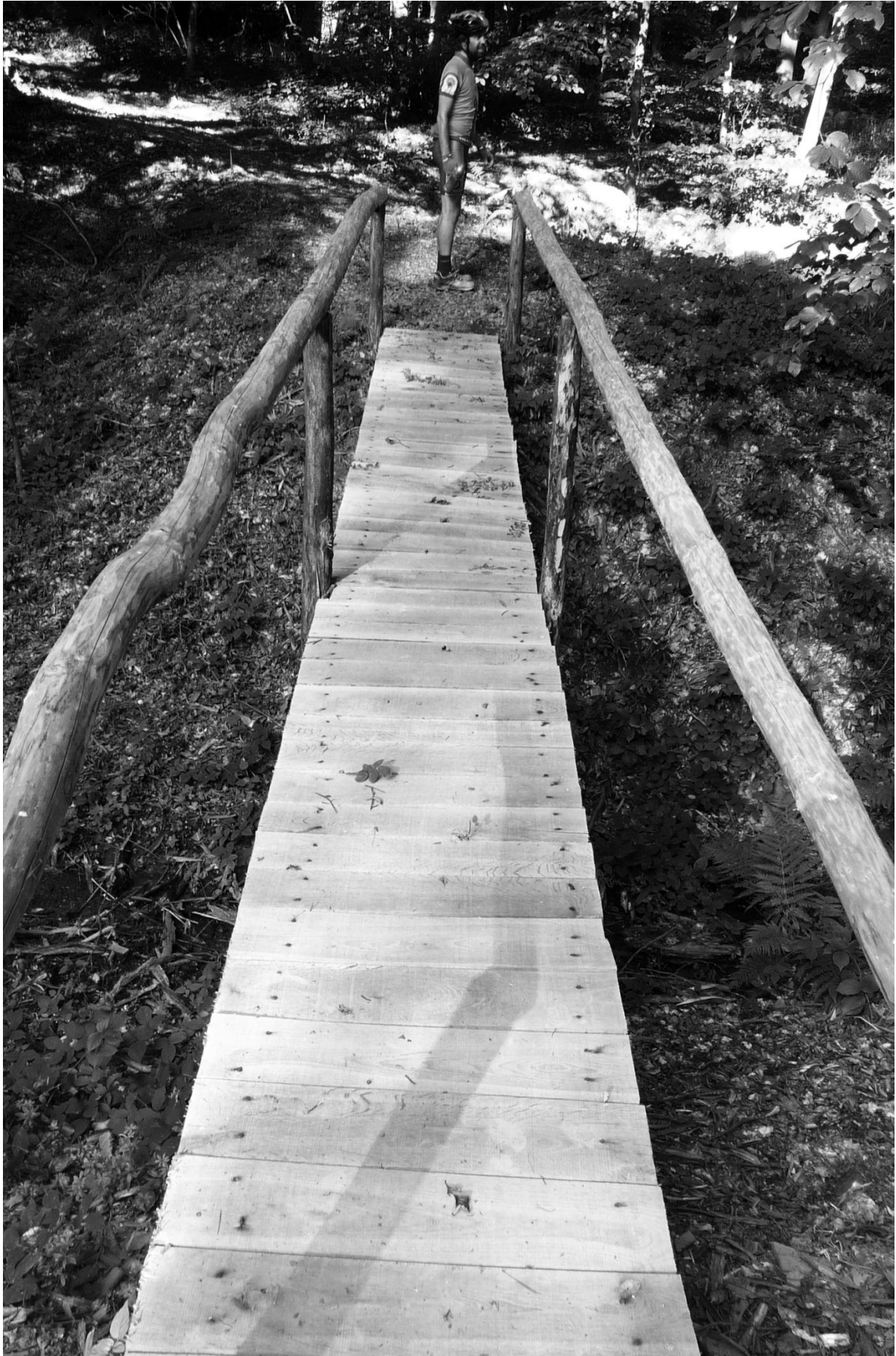
Photo 102. Bridge / Most