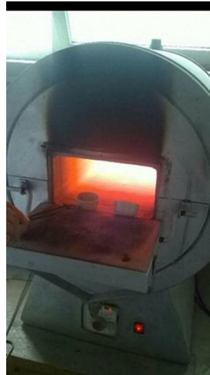
Slika 7, 8. Zdjelice u užarenoj peći