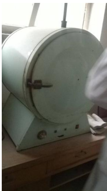
Slika 6. Sušionik