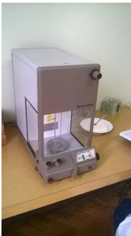
Slika 4. Vaga