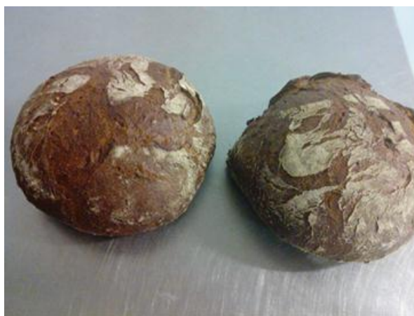
Slika 2. Purpur gotovi kruh

Posebna vrsta kruha, proizvodi se od samljevenog cijelog zrna purpur pšenice (koja ima jak, začinski ukus) i raži. Sadrži orahe i sjemenke bundeva koje poboljšavaju miris i okus te pružaju bogatstvo vitamina, minerala i esencijalnih masnih kiselina. Povećani sadržaj bjelančevina, dijetalnih vlakana i visokog sadržaja antocijana (koji se mogu naći čak i kod crnih grožđa) daje ovom kruhu izvjesna prehrambena svojstva. Zadržava svježinu najmanje 5 dana, na sobnoj temperaturi. Produženu svježinu mu osiguravaju aditivi prirodnog porijekla. U sastavu je prisutno i sušeno tijesto (bogato organskim kiselinama) koje daje posebnu aromu i kiseo okus, što također utječe na produženu svježinu i sporije starenje kruha (Žitoprodukt, proizvodi, Panonska lađa 16.03.2018., url).