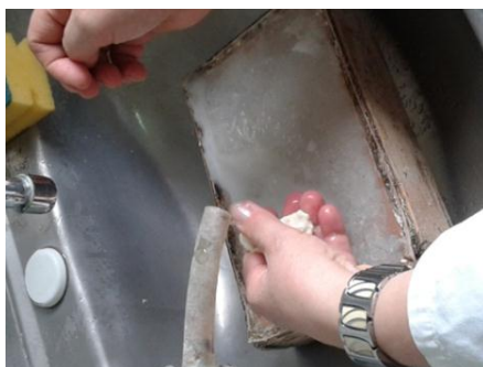
Slika 9. Ispiranje glutena 2 % - tnom otopinom soli i destilirane vode