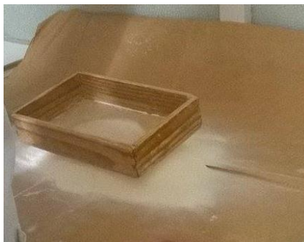
Slika 3. Prosijano brašno

Analiziralo se pšenično brašno tipa 550, ćelija 22. uzorak od 2 kg je priređen od uzoraka brašna. Brašno se nakon toga prosijava (Slika 3) da bude ujednačeno i da se prozračí. Prosijavanje služi kako bi se uklonila strana tijela iz brašna i zatim se vraća u vrećicu (Radna uputa za provođenje fizikalno – kemijskih analiza. PJ Požežanka u Požegi, 2016).