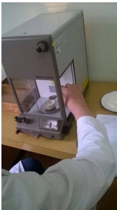
Slika 5. Vaga s metalnom zdjelicom