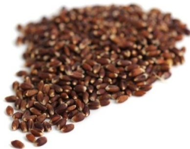
Slika 1. Purpur pšenica (Organic purple wheat whole grain plain flour 04.04. 2018., url.)

Proizvodi od ove vrste pšenice, prije svega kruh, prave se od brašna dobivenog mljevenjem cijelog zrna žita. Obično se kombinira s raženom brašnom i kruhom koji daje jak i specifičan ukus. Dodavanjem koštunjavog voća i sjemenki, dobivamo izuzetno ukusan kruh bogat proteinima, esencijalnim masnim kiselinama, mineralima i antocijanima. Ovakav kruh je odličan saveznik u prevenciji brojnih oboljenja koje među etiološkim faktorima imaju i nepravilnu prehranu (Purpurna pšenica 16.03.2018., url).