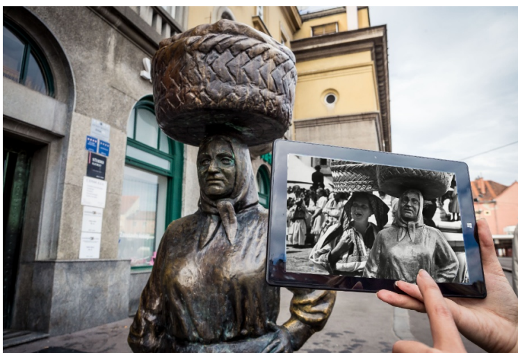
Slika 5. Turistički vremeplov Zagrebom