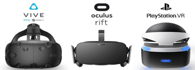
Slika 2. prikaz HMD uređaja