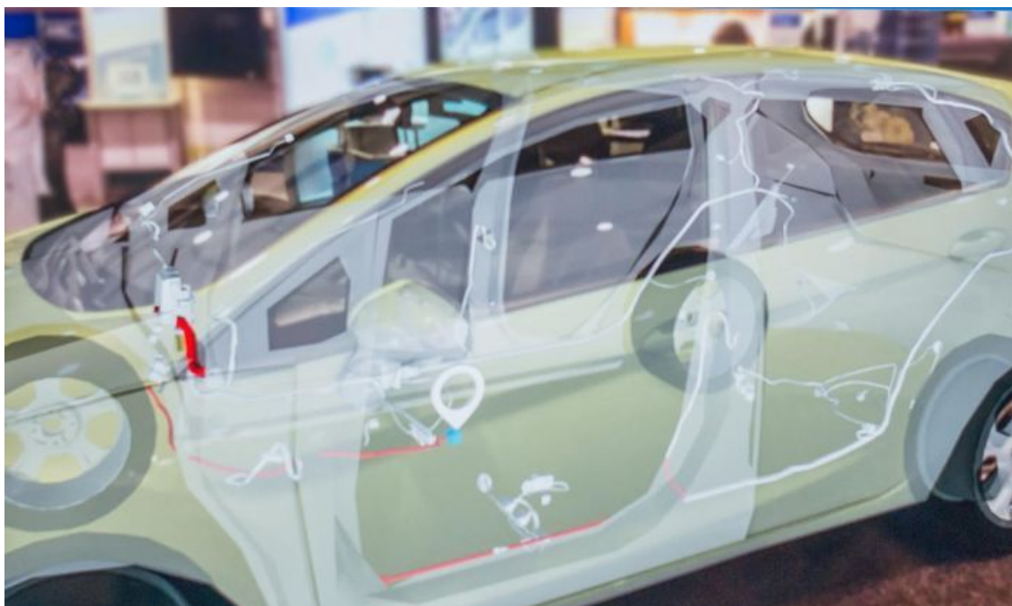
Slika 3. Tržište budućnosti je u okviru proširene stvarnosti