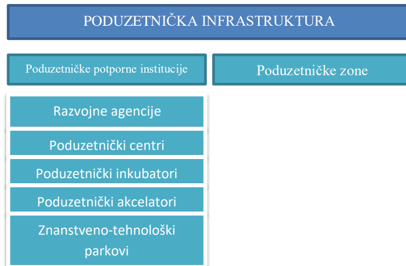
Shema 1: Poduzetnička infrastruktura

„Primjena navedenih aktivnosti nosi sa sobom postojanje Jedinog registra poduzetničke infrastrukture, ali i mrežne stranice na čijim se stranicama pregled vrši prema vrsti poduzetničke aktivnosti, pripadajućoj županiji i prema abecednom redoslijedu. Međutim, vidljivi su određeni problemi njegovom primjenom kao što su zastoje koji uvjetuje nepotpun i neiscrpan pregled čitave poduzetničke infrastrukture na teritoriju države Republike Hrvatske“ (Ministarstvo gospodarstva, poduzetništva i obrta, 2017, url)