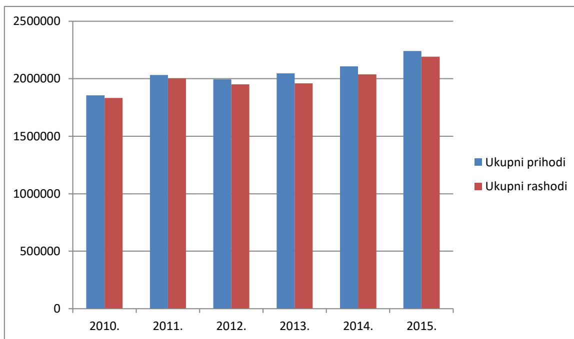
Grafikon 2. Ukupni prihodi i rashodi poduzetnika grada Požege od 2010. do 2015. godine

Plamen d.o.o. je društvo koje se nalazi na drugom mjestu u tablici poduzetnika, a čiji prihodi iznose 169,2 milijuna kuna, dok sa izvozom od 132.639 milijuna kuna čini 27,4% ukupno ostvareni iznos sa sjedištem u Požegi. Međutim, izuzev navedena 4 društva koji izvoze svoje proizvode i usluge, potrebno je izdvojiti i COLOR EMAJL d.o.o. koji su izvezli robu u vrijednosti od 101 milijuna kuna u 2015. godini.