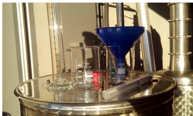
Slika 6. Pribor potreban za maceraciju