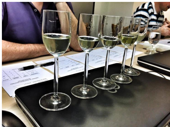
Slika 2. Likeri na ocjenjivanju