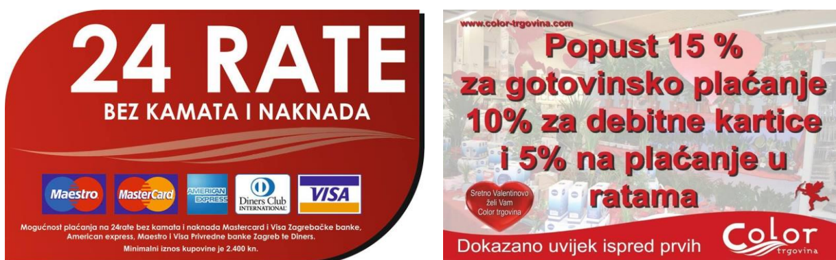
Slika 20. Pogodnosti plaćanja