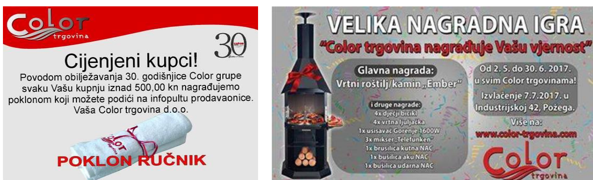
Slika 21. Promotivne akcije i nagradne igre