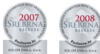
Slika 11. Srebrna nagrada - među top 1000 poslovnih subjekata u RH