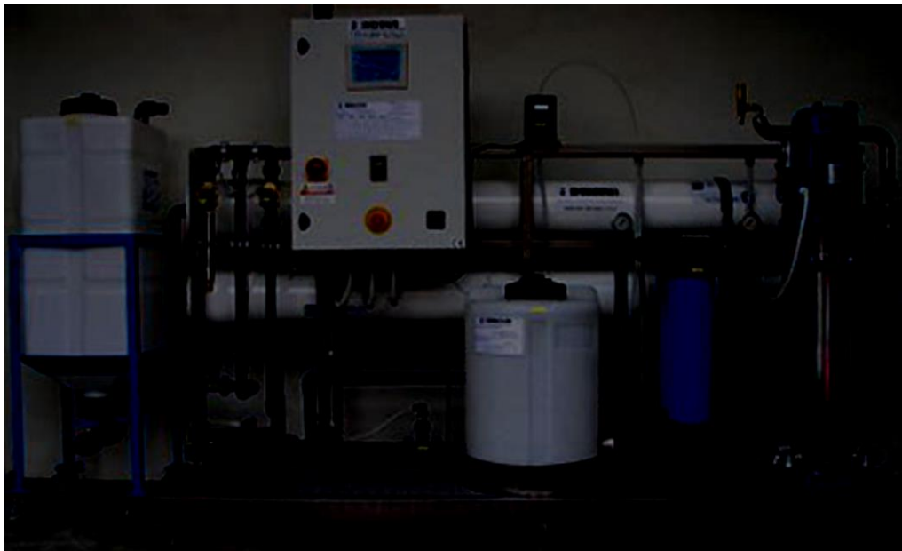
Slika 1. Uređaj za reverznu osmozu u Zvečevu

Za proizvodnju Domaćeg Brenda koristi se demineralizirana voda koju proizvođač Zvečevo proizvodi u uređaju za reverznu osmozu. Uređaj za reverznu osmozu (Slika 1.) proizvodi vodu elektrovodljivosti 10 - 20 \mu\text{s}/\text{cm} . Takva voda ne sadrži karbonate (kalcij i magnezij). Prilikom razrjeđivanja alkohola, ako se koristi tvrda voda može doći do povećanog zagrijavanja i hlapljenja alkohola, te do pojave taloženja u gotovom proizvodu. U konačnici, proizvod kao takav biti će neprihvatljiv, te se bi se morala naknadno provesti njegova stabilizacija infiltracijom, što bi povećalo troškove proizvodnje (scribd, 2.5.2017., url).