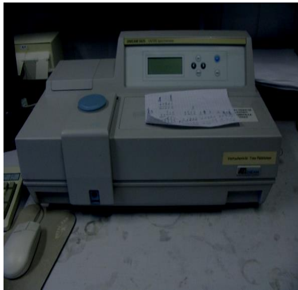
Slika 5. Spektrofotometar