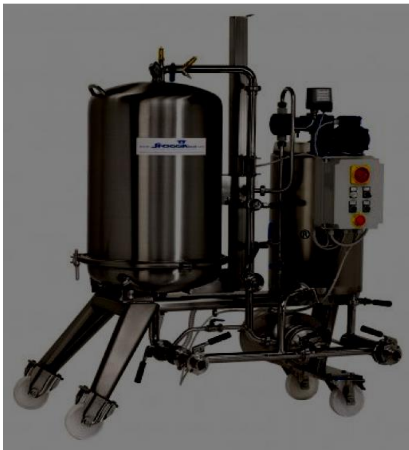
Slika 3. Naplavni filter u Zvečevu kapaciteta 100 hl/h.

Diatomejska zemlja je prikladna za finiju filtraciju, a perlit (mljevena zemlja vulkanskog podrijetla) koristi se za grublju filtraciju. Moguće ih je i kombinirati. Celulozna se vlakna koriste za učvršćivanje filtracijskog sloja. Naplavlivanje se obavlja na početku filtracije kružnim cirkuliranjem proizvoda koji se filtrira, a kojem je dodan naplavni materijal. U trenutku kada je postignut početni naplavni sloj, počinje filtracija tijekom koje se nastavlja preko dozirne crpke filtera dodavanje izmiješanog naplavnog materijala kako bi se filtracijski sloj održavao rahlim i propusnim. Kada je filtracijski sloj zasićen mutnoćama proizvoda koji se filtrira, tlak naraste do dopuštene granice i protok se smanjuje. Filter se tada prazni, naplavni sloj koji je polusuh skida se s tanjura i filter se pere. Pranje se može obavljati ručno ili automatski. Količina upotrijebljenoga naplavnog materijala u jednom ciklusu je određena i ograničena i treba u tijeku rada biti kontrolirana (krizevci, 29.5.2017., url).