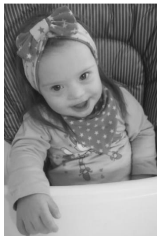
Slika 2. Djevojčica s trisomijom 21 (Down sindrom) [23]