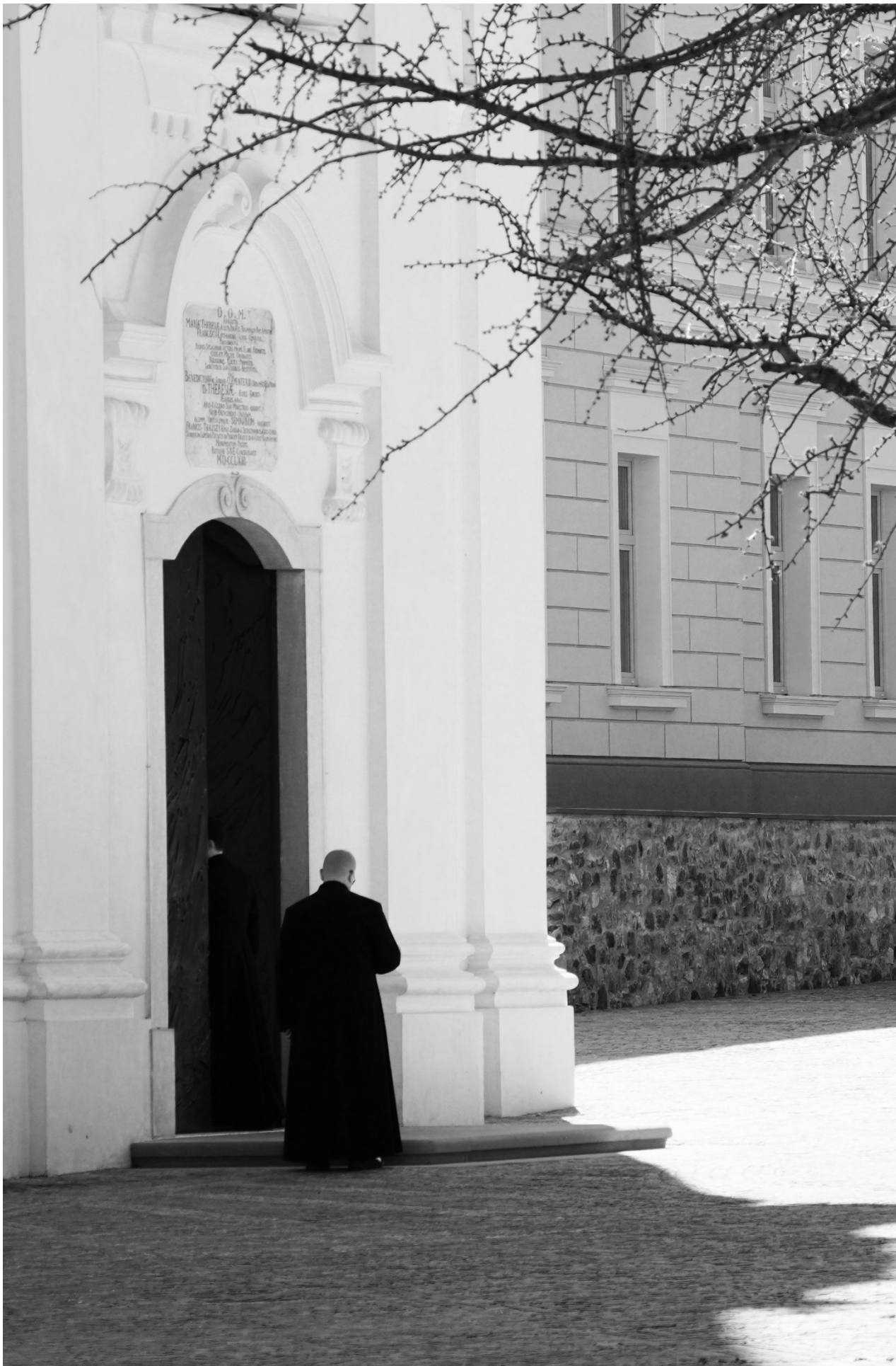
Photo 076. Svećenik / Chaplains