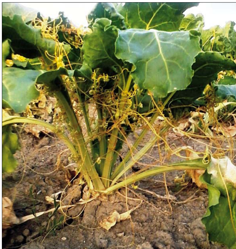
Obr. 1. Kokotice plní parazitující v cukrové řepě

Kokotice roste okolo 7 cm za den, a tak může v období růstu jedna rostlina pokrýt až 3 m 2 (1). Může se také rozšířit a napadnout další hostitelské rostliny, jsou-li v blízkosti, často pak tváří hustou vláknitou masu. Kvetení nastává od pozdního jara až do podzimu v závislosti na druhu a stanovišti. Květy jsou početné, úzké, bělavé až narůžovělé (obr. 2.). Vytvářejí kulovitá květenství okolo stonku. Plodem jsou malé kulovité tobolky se 2–4 semeny. Semena kokotice jsou sféroidního tvaru, většinou 0,5–1 mm v průměru. Mají tvrdé, pevné osetí, v závislosti na druhu se může lišit tloušťkou. Semena jsou schopna přežít v půdě přes dvacet let. K narušení obalu semene