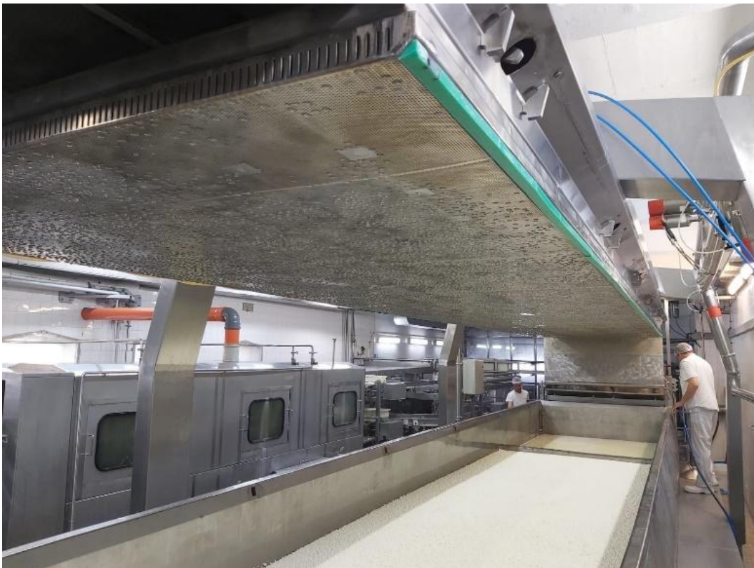
Slika 9. Predpreša

Dužina prešanja ovisi o vrsti sira, a polutvrđi sirevi se prešaju 25-30 minuta pri tlaku od 2 bara. Nakon prešanja stvori se kompaktna masa koja linijom dolazi na čelične noževe koji režu masu na podjednake blokove, veličine 320x268 mm. Blokovi sira linijom dalje upadaju u plastične kalupe koji se automatski zatvaraju plastičnim poklopcem te odlaze na prešanje. Prešanje se odvija u 4 faze pod različitim tlakovima. Prva faza traje 5 minuta pod tlakom od 1 bara, druga faza traje 10 minuta pod tlakom od 1,7 bara, treća faza traje 15 minuta pod tlakom od 2,9 bari i četvrta faza traje 30 minuta pod tlakom od 5 bara. Nakon što se završi prešanje, plastični kalupi se automatski okreću kako bi sir ispao na traku koja ga odvodi do kade na salamurenje (Interni podaci mljekare).