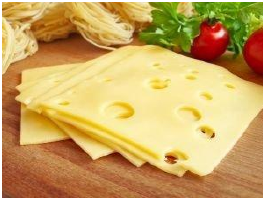
Slika 2. Emmentaler

Mikrobne kulture koje se dodaju pri proizvodnji sira pogoduju nastanku sastojaka arome jer razgrađuju bjelančevine i laktozu, a neke kulture čak pogoduju i stvaranju plina zbog čega neke vrste sireva mogu imati veće ili manje rupice, kao primjerice trapist, ementaler i grojer.