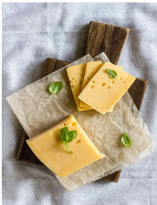
Slika 4. Edamer (Sirevi hr, 2018,URL)

Ementaler je vrsta polutvrdog sira kojeg karakteriziraju rupice te njegova žuta boja. Rupe na ementaleru nastaju oslobađanjem ugljikovog dioksida do kojeg dolazi zbog trošenja mliječne kiseline jedne od bakterija koje su potrebne za proizvodnju ementalera te se tada ugljikov dioksid skuplja u balončićima te tako nastaju karakteristične rupe (Sirevi hr, 2018, URL).