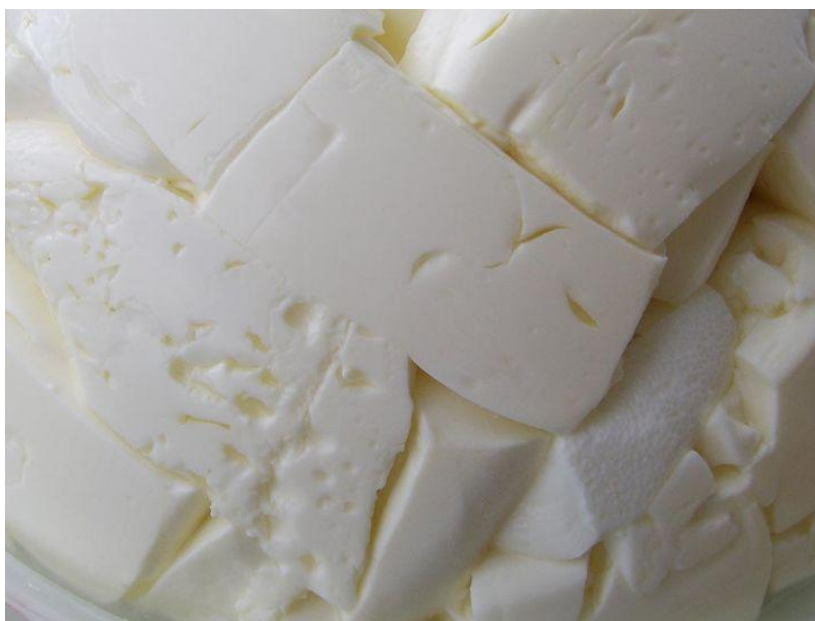
Slika 1. Mladi kravljji sir (Dobra kuhinja, 2021, URL)

Postoje mnoge razlike u proizvodnji raznih vrsta sireva. „U proizvodnji svježega mekog sira grušanje se provodi djelovanjem kiselina nastalih fermentacijom mliječnoga šećera (laktoze) s pomoću bakterija mliječno-kiseloga vrenja (što može trajati 12 do 16 sati) te se stvara kiseli gruš (pH \approx 4,6), a u proizvodnji ostalih sireva grušanje se provodi djelovanjem proteolitičkih enzima (sirišnih preparata mikrobnog ili životinjskoga podrijetla) u prisutnosti kalcijevih iona te se već nakon 40 do 60 min stvara slatki gruš“ (Hrvatska enciklopedija, URL). Gruš se odvaja od sirutke na način da se zagrijava na visokim temperaturama pri čemu se grušaju termolabilne bjelančevine, kako bi se stvorio slatki sirutkin gruš. Guševi se cijede i tada nastaju meki sirevi, koji su svježiji i imaju često kraći rok trajanja od drugih sireva.