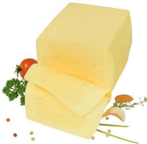
Slika 3. Gouda (Sirevi hr, 2017, URL)

Gauda je vrsta polutvrdog sira koji se proizvodi od kravljeg mlijeka. Kolut gauda zna težiti do 20 kg te može zrijeti od 4 tjedna do 3 godine. „Postoji šest gradacija zrenja goude: mladi sir zrije 4 tjedna, mladi zreliji sir od 8 do 10 tjedana, zreli sir od 16 do 18 tjedana, ekstra zreli od 7 do 8 mjeseci, stari sir od 10 do 12 mjeseci, a kod vrlo starog sira zrenje traje više od godinu dana“ (Sirevi hr, 2017, URL).