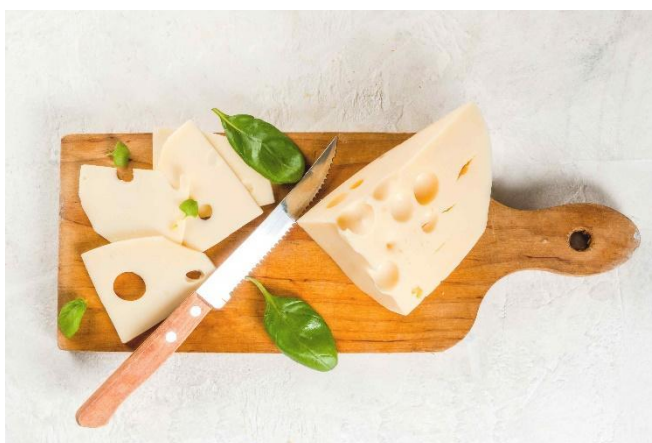
Slika 5. Ementaler (Sirevi hr, 2018, URL)

Ementaler je vrsta polutvrdog sira kojeg karakteriziraju rupice te njegova žuta boja. Rupe na ementaleru nastaju oslobađanjem ugljikovog dioksida do kojeg dolazi zbog trošenja mliječne kiseline jedne od bakterija koje su potrebne za proizvodnju ementalera te se tada ugljikov dioksid skuplja u balončićima te tako nastaju karakteristične rupe (Sirevi hr, 2018, URL).