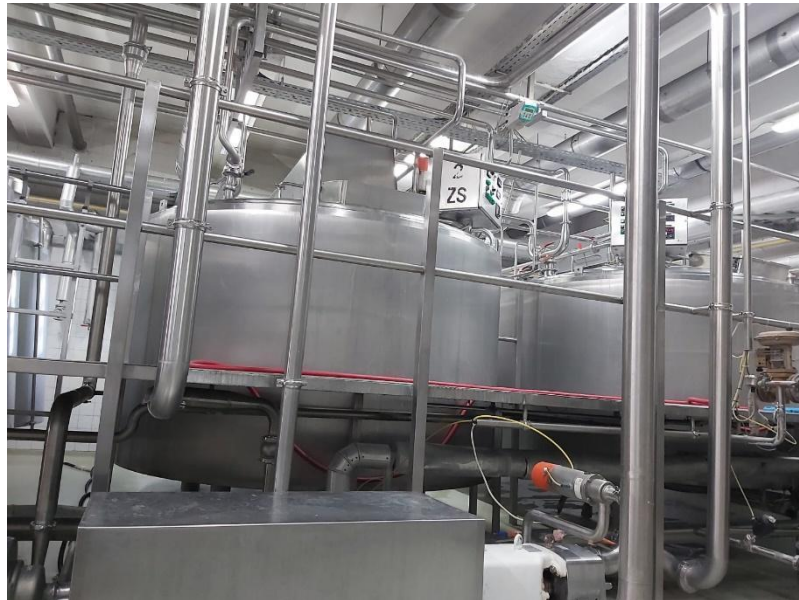
Slika 8. Zgotovljač

Transport mlijeka od tankova do sirane vrši se zatvorenim sistemom cjevovoda i prolazi kroz mjerač protoka kako bi se mogla pratiti količina zaprimljenog mlijeka nakon čega mlijeko ulazi u zgotovljače.