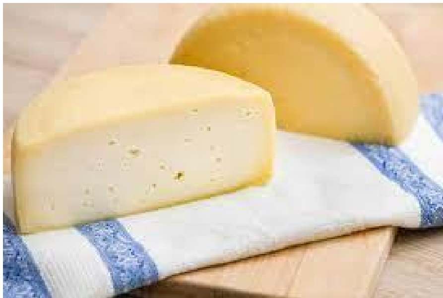
Slika 6. Trapist (Sirevi hr, 2017, URL)

Trapist je vrsta polutvrđog sira koji se proizvodi od kravljeg mlijeka, kao i gauda. Trapist je malo masniji od ostalih polutvrđih sireva te je poznat po svojoj slamnato-žutoj boji te karakterističnom kiselkastom okusu (Sirevi hr, 2017, URL).