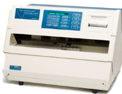
Slika 14. Cryoscope 4C3 (Labodidactica, n.d., URL)

Ledište mlijeka određuje se krioskopskom metodom na uređaju Cryoscope 4C3. Mlijeko se stavlja u kivete veličine 2,5 mL te se zatim kivete s mlijekom stavljaju u Cryoscope 4C3 i nakon 5 minuta dobiju se rezultati koji su iskazani u °C. Prema pravilniku o utvrđivanju sastava sirovog mlijeka sirovo mlijeko ne smije imati točku ledišta višu od -0,517 °C (NN 27/2017).