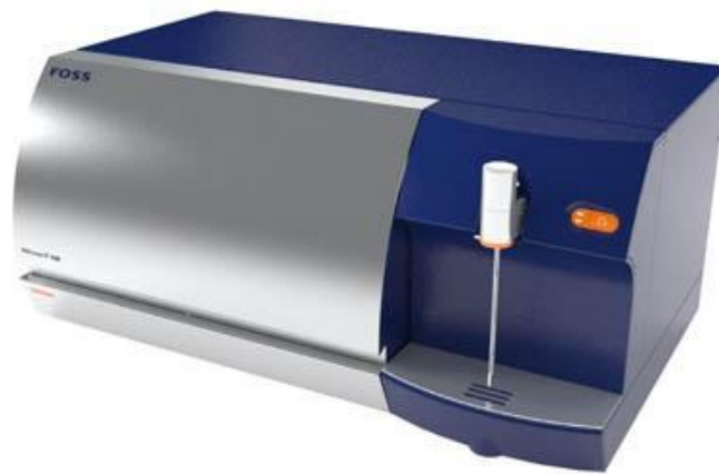
Slika 12. Milkoscan