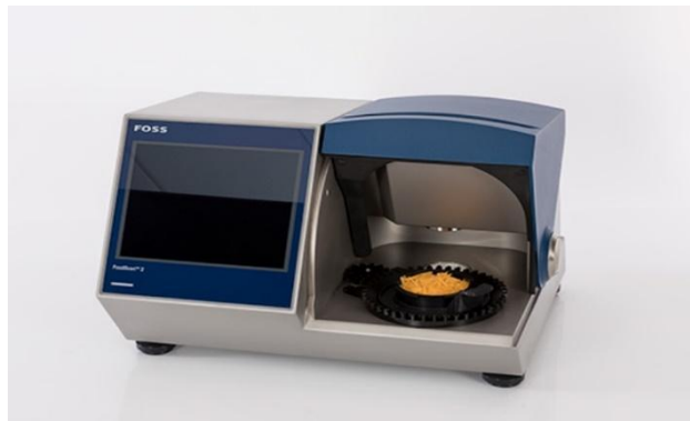
Slika 15. FoodScan (Dairy reporter. com, n.d., URL)

mjere svi parametri s minimalnim odstupanjima te rezultati budu gotovi već nakon 50 sekundi i pokazuju se na zaslonu uređaja. Jedan uzorak testira se 3 puta uzastopno te se za rezultat uzima srednja vrijednost parametara. Prema Pravilniku o sirevima i proizvodima od sireva udio vode u bezmasnoj tvari sira kod polutvrdih sireva mora biti između 54 % i 69 %, a mliječna mast između 45 % i 60 % (NN 20/2009).