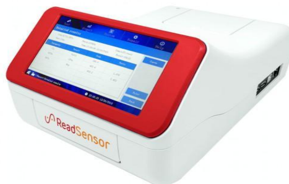
Slika 13. Readsensor 2 (Noack group, n.d., URL)

Aflatoksini i antibiotici određuju se putem uređaja koji se naziva Readsensor, ali različitim testovima. Aflatoksini se određuju testom MRL aflatoksin, a antibiotici testom Quad RUS. Antibiotici i aflatoksini mogu se određivati istovremeno. Kod određivanja antibiotika test traka se stavi u inkubator, preko test trake postavi se pipeta uz stjenku jažice za uzorak te se u jažicu odpipetira 300 \mu L mlijeka, poklopac se zatvori i nakon 6 minuta se dobiju rezultati. Mlijeko ne smije sadržavati antibiotike kako bi se smatralo ispravnim.