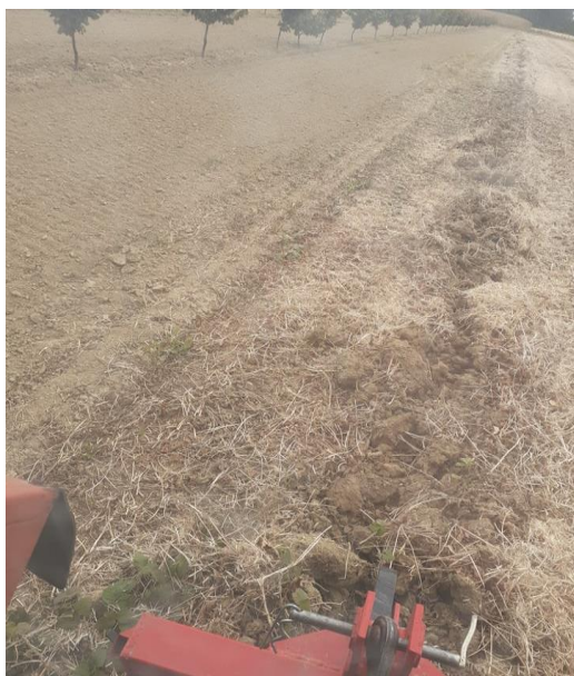
Slika 9. Podrivanje prije sadnje