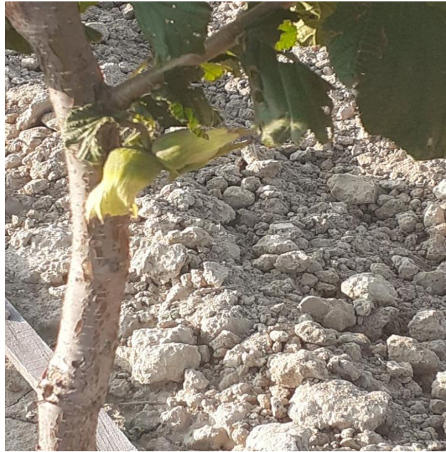
Slika 6. Plodovi lijeske u omotaču

plodova nekih sorti može biti otežana jer svi plodovi ne sazrijevaju istovremeno i kod nekih sorti se teško oslobađaju iz omotača. (Šoškić, 2006.)