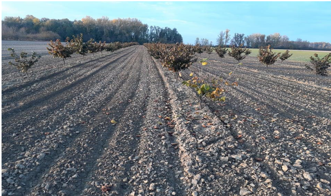
Slika 7. Nasad lijeske s prethodno opisanim sortama lijeske

Tonda Gentile delle Langhe je talijanska sorta lijeske velike bujnosti. Iako je grm, raste uspravno. Formira malo izdanaka pa se može uzgajati i kao stablašica na vlastitom korijenu. Pojedinih godina izražena je rodnost i do 38 kg po stablu. Zbog obilne rodnosti rađa alternativno. Dobrom agrotehnikom i pomotehnikom se može umanjiti alternativno rađanje što joj je inače bitan nedostatak. U Italiji se najviše uzgaja oko Latija. Cvjetanje je srednje kasno s promjenjivim karakteristikama: homogamija, proterandrija ili proteroginija. Dobar je oprašivač za većinu sorti, a nju dobro oprašuju sorte Daviana, Cosford i dr. Plodovi su srednje krupni (oko 2,8 g). Često rađa u grozdovima. U grozdu prosječno ima 2,3 ploda. Omotač je nešto duži od ploda, ljuska je tanka, svijetlokestenjaste boje i prugasta. Radman jezgre je oko 45 %. Sadrži oko 64 % masti, 17 % bjelančevina i 5,7 mg nezasićenih masnih kiselina. (Šoškić, 2006.).