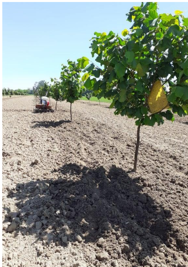
Slika 4. Uzgojni oblik stabala u našem nasadu (Vlastiti izvor)

razvija. U lipnju pincirane mladice se odrežu tako da im pri osnovi ostane 1 do 2 lista. U drugoj godini prije kretanja vegetacije uspravna mladica se skрати na nešto veću visinu od određene visine debla. Kad krene vegetacija, a mladice su porasle oko 5 cm, pincira se jedna do dvije ispod gornje (provodnice). Početkom srpnja odabere se jedna ili dvije mladice za postrane grane, a ostale se savijaju. U narednim godinama uzgajaju se postrane grane slično kao i kod grma. Vrhove postranih grana i provodnice treba stalno održavati slobodnim. Suvišne grane saviti ili odrezati kod zimske rezidbe. Kad se završi uzgoj, provodnica se ne skraćuje, nego se svodi na uspravniju granu nižeg reda. (Brzica, 1978.).