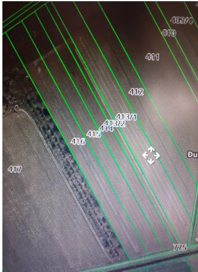
Slika 8. Nasad lijeske (čestica 413/1, 413/2 i 414)

U Selu Đurići na površini od 1.15 ha na obiteljskom poljoprivrednom gospodarstvu (OPG-u) Balog uz ratarske kulture odlučeno je se za sadnju lijeske. U našem nasadu posjedujemo četiri sorte lijeske, a to su: Istarski duguljasti, Rimski, Crvenolisni Lambert i Tonda Gentile delle Langhe. Za podizanje nasada potrebno je puno uložiti rada i volje, uvidjevši rezultate oduševljeni smo svojim radom i zalaganjem. Prije samog podizanja nasada potrebno je puno agrotehničkih mjera odraditi, ali ono najvažnije je podrivanje i nakon toga oranje. S tim zahvatima smanjujemo zbijenost tla, poboljšavamo poroznost tla, okrećemo i prorahljujemo zemlju, te omogućavamo puno bolji rast korijenja biljki.