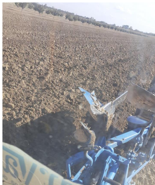
Slika 10. Oranje prije sadnje

Za poboljšavanje svojstva tla, prije oranja i podrivanja rasuto je na 1.15 ha 600 kg mineralnog gnojiva formulacije 0:20:30 (fosfor i kalij), to znači da treba izbjegavati dušik kako bi u startu smanjili rast i razvoj korova. Podrivanje i oranje je obavljeno traktorom Belarus 820, dvobraznim plugom okretačem marke (Lemken opal 90) i podrivačem s jednim tijelom firme (Jadranka Jelisavec). Nakon razmjerene parcele odlučeno je za sklop 5 x 4 m i 4 x 4 m pa je uslijedilo kopanje rupa koje je obavljeno svrdlom priključenim na traktor.