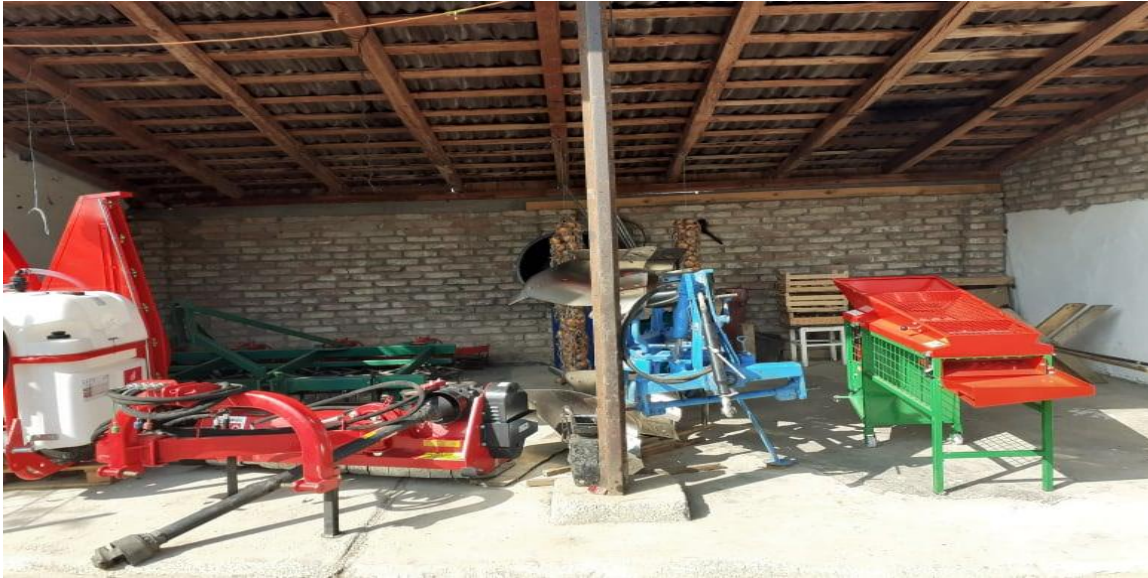
Slika 14. Mehanizacija za održavanje nasada i doradu lijeske

kupnju razne mehanizacije neophodne za održavanje nasada i doradu lijeske. U budućnosti cilj nam je povećati proizvodnju, uvesti navodnjavanje u nasad i kupiti stroj za sakupljanje lješnjaka (usisavač).