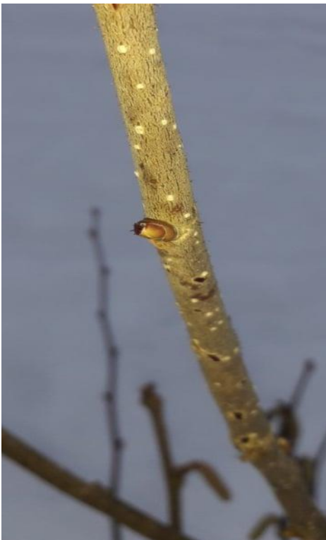
Slika 2. Ženski cvijet lijeske

Cvijet (flos) je generativni, dakle rasplodni organ iz kojeg nakon oprašivanja (polinacije) i oplodnje (fekundacije) nastaje plod s jednom sjemenkom. Sastoji se od bitnih i nebitnih dijelova. Cvjetovi lijeske dolaze u inflorescencama. Ljeska ima odvojeno, odnosno posebno muške, a posebno ženske cvjetove koji dolaze u resama (inflorescencama) na istom stablu pa je jednodomna biljka. (Miljković, 2018.).