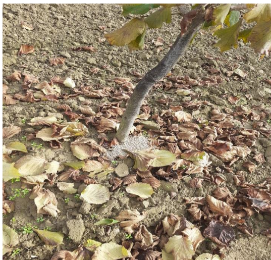
Slika 5. Gnojidba lijeske

Ako je poslije kemijske analize tla obavljena meliorativna gnojidba pa je tlo najpovoljnije opskrbljeno s fosforom i kalijem, prve četiri godine lijeska se gnoji samo s dušikom i to u rano proljeće prije vegetacije, oko grmova (nešto šire od uboda krošnje) s 0,5 kg prve godine, 0,6 kg druge godine, 0,8 kg treće godine i 1 kg mineralnog gnojiva KAN 27 % četvrte godine. Od četvrte do osme godine nasad lijeske gnoji se mineralnim kompleksnim NPK gnojivima i KAN-om po cijeloj površini nasada. Kompleksni NPK rasipa se tijekom jeseni. Takvom gnojidbom trebalo bi dodati oko 20 kg/ha fosfora i 150 kg kalija/ha. U proljeće se po cijeloj površini voćnjaka rasipa oko 100 kg dušika odnosno 350 kg/ha KAN-a. Od osme godine i dalje se lijeska gnoji po istom načelu kao poslije četvrte godine, s tim da se za 35 % povećavaju količine pojedinih hranjiva. (Krpina, 2004.).