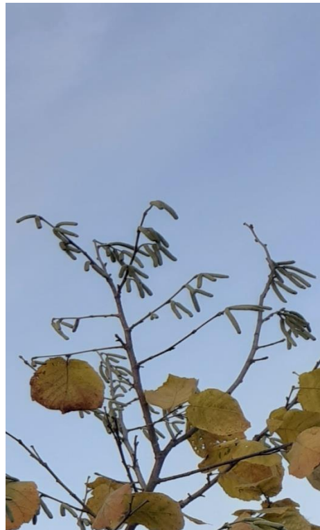
Slika 3. Muški cvijet lijeske