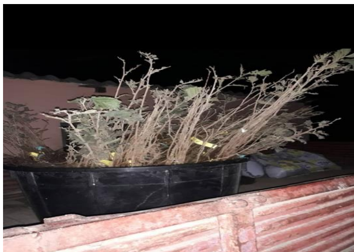
Slika 12. Sadni materijal

Iznos sadnica je 17 kn s PDV-om , kupljne su u rasadniku "Displantarium", Staro Petrovo Selo. Dakle, iznos sadnog materijala je 10200 kuna za cjelokupan nasad. U našem nasadu uzgojni oblik je stablo. Saditi se smiju samo kvalitetne sadnice (prema standardu) i sorte koje se mogu međusobno oploditi. Naime, jedna sorta (makar u nasadu bilo mnogo grmova/stabala iste sorte) ne može sama sebe oploditi pa je potrebna druga sorta (oprašivač). Budući da lijeska cvate zimi, oprašuje se vjetrom i vrlo dugo cvate , a radi sigurnije oplodnje u nasadu se sade najmanje tri međuplodne sorte.