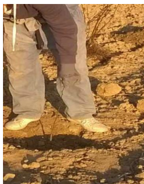
Slika 13. Sadnja lijeske

Odabir pogodne lokacije za sadnju lijeske je ključan. Potrebno je voditi računa o tri osnovna ekološka čimbenika: klimi, tlu i položaju te o njihovim međusobnim odnosima. Nepoštivanje klimatskih čimbenika može ugroziti buduću proizvodnju. Povoljne klimatske prilike u vrijeme cvatnje i oplodnje i dobar odabir položaja jamče dobru kvalitetu i pravilan razvoj ploda. (Vujević, 2010.).