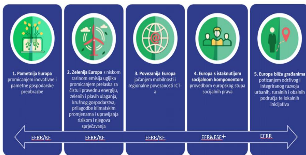
Shema 1. Prioriteti kohezijske politike za razdoblje 2021.-2027.godine (Regionalni koordinator Istre, URL, [pristup 20.7.2021.]

Korisnici nacionalnih infrastrukturnih projekata uglavnom su tijela javne vlasti, no za poslovni sektor prilike se otvaraju sudjelovanjem u javnoj nabavi za isporuku dobara i usluga.