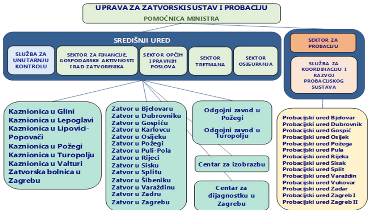
Slika 1. Ustroj Zatvorskog sustava