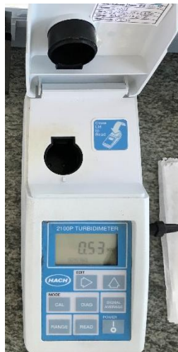
Slika 4. Turbidimetar

Mutnoća se mjeri metodom turbidimetrije pomoću uređaja turbidimetra. U čašicu uliti uzorak vode te staviti u uređaj. Rezultat se izražava u NTU jedinicama (engl. Nephelometric Turbidity Unit ) (Arhiva Zavoda za javno zdravstvo Požeško-slavonske županije).