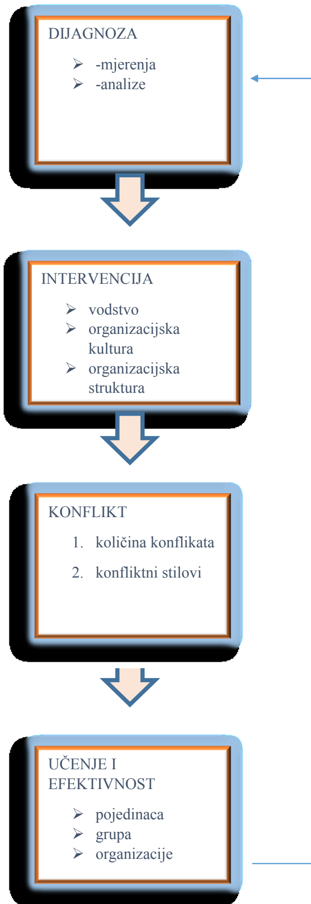
Slika2.Prikaz procesa upravljanja konfliktom