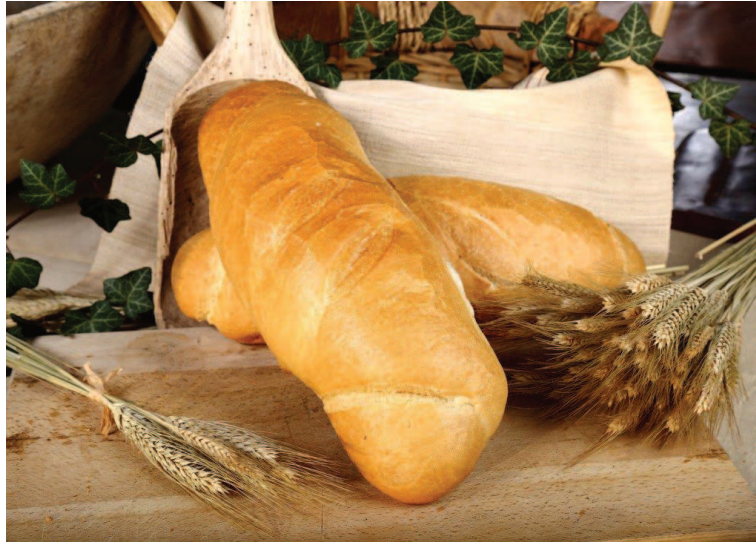
Slika 15. Narodni kruh 500 g (Gradska pekara, n. d., URL)