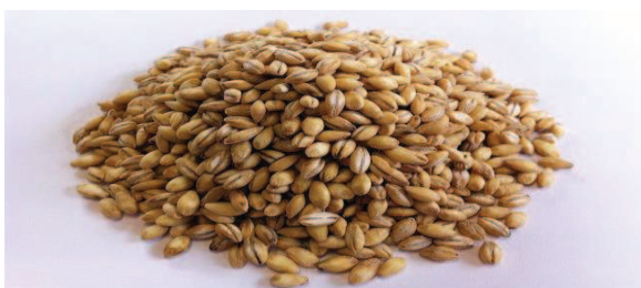
Slika 5. Ječam (Novi, 2018, URL)

Ječam se smatra jednom od najstarijih žitarica u Europi. Još u kamenom dobu se sijao dok se u starom Egiptu i Mezopotamiji kultivirao. Uz uobičajenu primjenu u kuhinji, Sumerani su ga koristili i kao sredstvo plaćanja. Također poznato je kako je ječam jedan od sastojaka za proizvodnju piva, pa se tako i u Babilonu od njega pravila kaša i pivo (Pedrotti, 2003: 69 – 71).