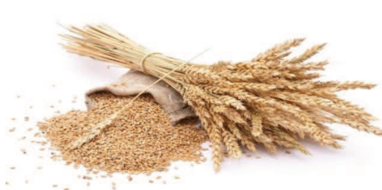
Slika 9. Klas i zrno pšenice (Zdravlje i sreća, 2012, URL)

Pšenica je najrasprostranjenija žitarica, te se u svijetu uzgaja na čak \frac{1}{4} obradivih površina. Najviše se koristi za proizvodnju kruha i tjestenine. Današnje sorte pšenice dobivene su selekcijom divljih samoniklih oblika iz porodice trava, a porijeklom je s prostora današnje Turske odakle se raširila u Afriku i sve ostale dijelove svijeta. Uzgajanje pšenice u povijesti čovječanstva se razvijalo usporedno s postupnim napuštanjem nomadskog načina života i prelaskom na sjedilački način i bavljenje poljoprivredom (Pedrotti, 2003: 21 – 23).