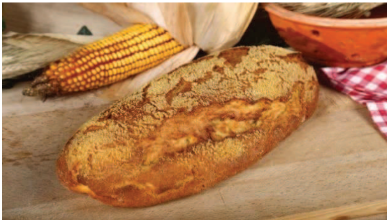
Slika 11. Kukuruzni kruh 700 g (Gradska pekara, n. d., URL)

zatim se prebacuje u automatsku djelilicu. Odvaga na automatskoj djelilici se namješta na 800 g te se tako odvagano tijesto prebacuje na stol za oblikovanje. Tijesto se oblikuje ručno u dugoljaste oblike tzv. štruce, određenom tehnikom prematanja te se umače u kukuruzni koncentrat koji predstavlja posip i tako oblikovano slaže na podloške. Tako oblikovano tijesto na podlošcima odvozi se u fermentacijsku komoru gdje fermentira 40 minuta na temperaturi 35 °C i relativnoj vlažnosti od 70 %. Nakon što fermentacija završi, oblikovano tijesto se s podložaka slaže u etažnu peć. Kada se peć zatvori, pušta se vodena para 20 sekundi, a zatim započinje proces pečenja. Kukuruzni kruh se peče 35 minuta na 230 °C. Kada se kruh ispeče, vadi se na kolica za kruh te odvozi u istovarni prostor gdje se hladi i odlazi na daljnje pakiranje. Za potrebe izračunavanja parametra upeka kruha, vaganje se vrši odmah nakon vađenja kruha iz peći, na analitičkoj vagi. Kalo hlađenja ne ubraja se u upek pečenja.