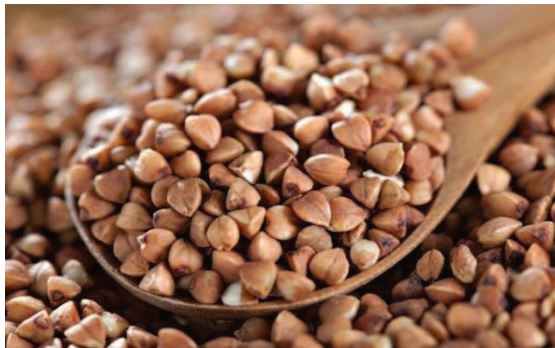
Slika 7. Heljda (Melly's food, 2018, URL)

Heljda ne sadrži gluten što je zahvalno za sve veću upotrebu u izradi kruha i ostalih pekarskih proizvoda za populaciju čiji je probavni sustav intolerantan na gluten. Osim kvalitetnim ugljikohidratima, heljda sadrži i visokokvalitetne i lako probavljive proteine. Također je bogata i vitaminima B1 i B2 koji su neophodni za metabolizam ugljikohidrata u organizmu (Krikšić, 2017, URL).