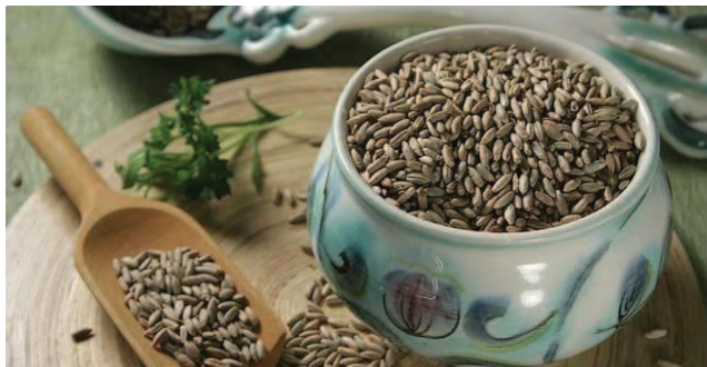
Slika 3. Raž (Coolinarika, n. d., URL)

U klici raži ima puno bjelančevina, masti, šećera i vitamina te mineralnih tvari, zbog čega se upotrebljava u industriji za proizvodnju visokovrijednih hranjivih sastojaka. Najveći proizvođači raži su Rusija, Poljska, Ukrajina, Bjelorusija i Njemačka. (Pinova, n. d., URL)