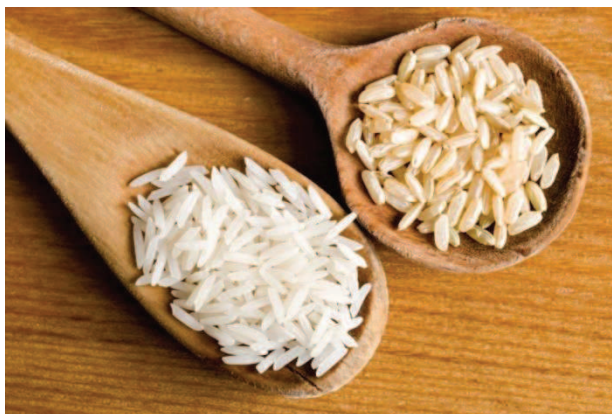
Slika 6. Zrna riže (C., 2015, URL)

Riža je žitarica iz porodice trava koja dolazi pretežno iz tropskih i suptropskih predjela Azije i Afrike. Pripada među širokolisne trave, jednogodišnja je biljka i naraste do 1,8 m visine. Za uzgoj je potrebno puno vode i ljudskog rada, a kultiviranje riže je započelo prije više od 6 500 godina. Godišnja proizvodnja riže u svijetu iznosi oko 600 milijuna tona (Wikipedija, n. d., URL).