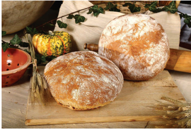
Slika 13. Domaći kruh 1000 g (Gradska pekara, n. d., URL)