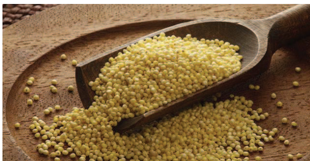
Slika 4. Proso (Coolinarika, n. d., URL)

Proso je vrlo hranjiva žitarica bogata biljnim vlaknima i proteinima, no ne sadrži gluten. To je jedan od razloga što je proso pogodno za vegetarijance i ljude koji boluju od celijakije. Drugi nazivi za proso su sitna proja, proha, jagle, muha ili prosa. Proso ne sadrži mnogo kiseline koja bi mogla utjecati na pH želudca stoga je vrlo probavljiv osobama koje pate od žgaravice. Također ima niski glikemijski indeks, odnosno ne sadrži puno šećera. (Žuna, 2018, URL)