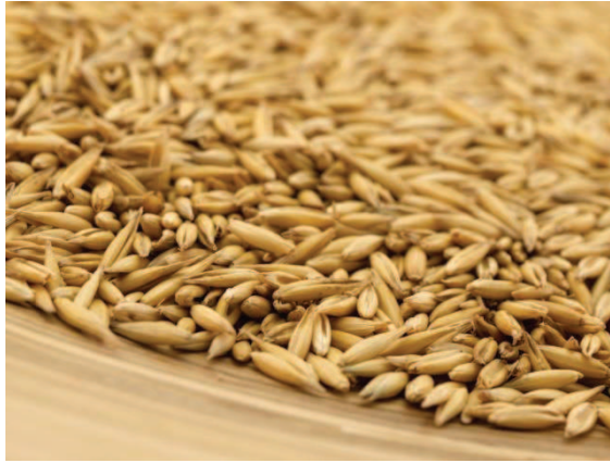
Slika 8. Zob (Advent, n. d., URL)

Zrno zobi je odlična stočna hrana, no sve više se ponovno upotrebljava i u ljudskoj prehrani u obliku krupice, ljuskica, brašna te zobenih pahuljica. S obzirom na ostale žitarice, zob sadrži i do tri puta više masti, dok su bjelančevine znatno probavljivije (Pinova, n. d., URL).