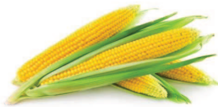
Slika 2. Klipovi kukuruza (Duhaček, 2014, URL)

Postoje dvije osnovne vrste kukuruza, bijeli i žuti. Žuti je bogat karotenom koji daje zrnju žutu boju. Zrna su prilično rožnata ili staklasta te poredana u pravilnim nizovima duž klipa (tipičan oblik klipa), dok veličina klipa ovisi o sorti.