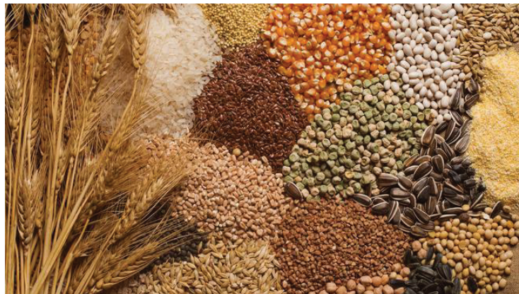
Slika 1. Žitarice

Porodica trava, kojoj pripadaju i žitarice, vrlo je rasprostranjena, postoji oko 5 000 vrsta što je impresivan broj. Žitarice spadaju u biljke koje se razmnožavaju vjetrom, tj. u anemofile. Također žitarice daju i brašno, stoga spadaju i u skupinu cerealijske, prema rimskoj božici žetve Cereri, poštovanoj u kultovima starih Rimljana, s obzirom na to da su žitarice predstavljale osnovnu namirnicu u svakodnevnoj prehrani (Matvejević, 2009: 79).