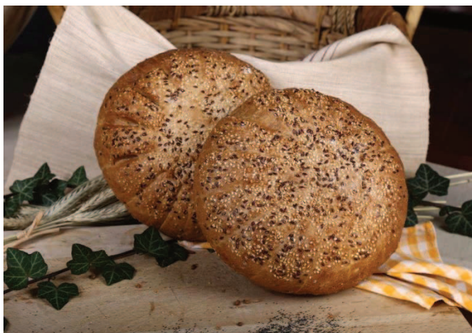
Slika 14. Bakin kruh 500 g (Gradska pekara, n. d., URL)