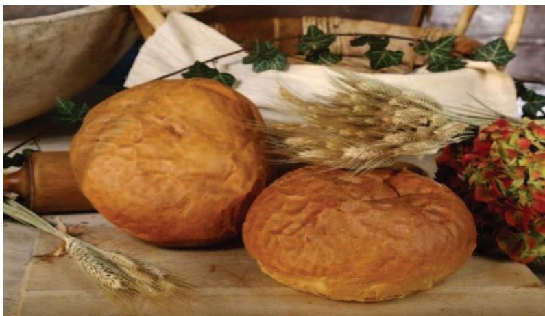
Slika 12. Raženi kruh 700 g (Gradska pekara, n. d., URL)

započinje pečenje. Pečenje traje 30 minuta na 230 °C. Nakon pečenja kruh se odvozi na hlađenje i odmaranje, te potom na potrebno pakiranje. Za potrebe izračunavanja parametra upeka kruha, vaganje se vrši odmah nakon vađenja kruha iz peći, na analitičkoj vagi. Kalo hlađenja ne ubraja se u upek pečenja.