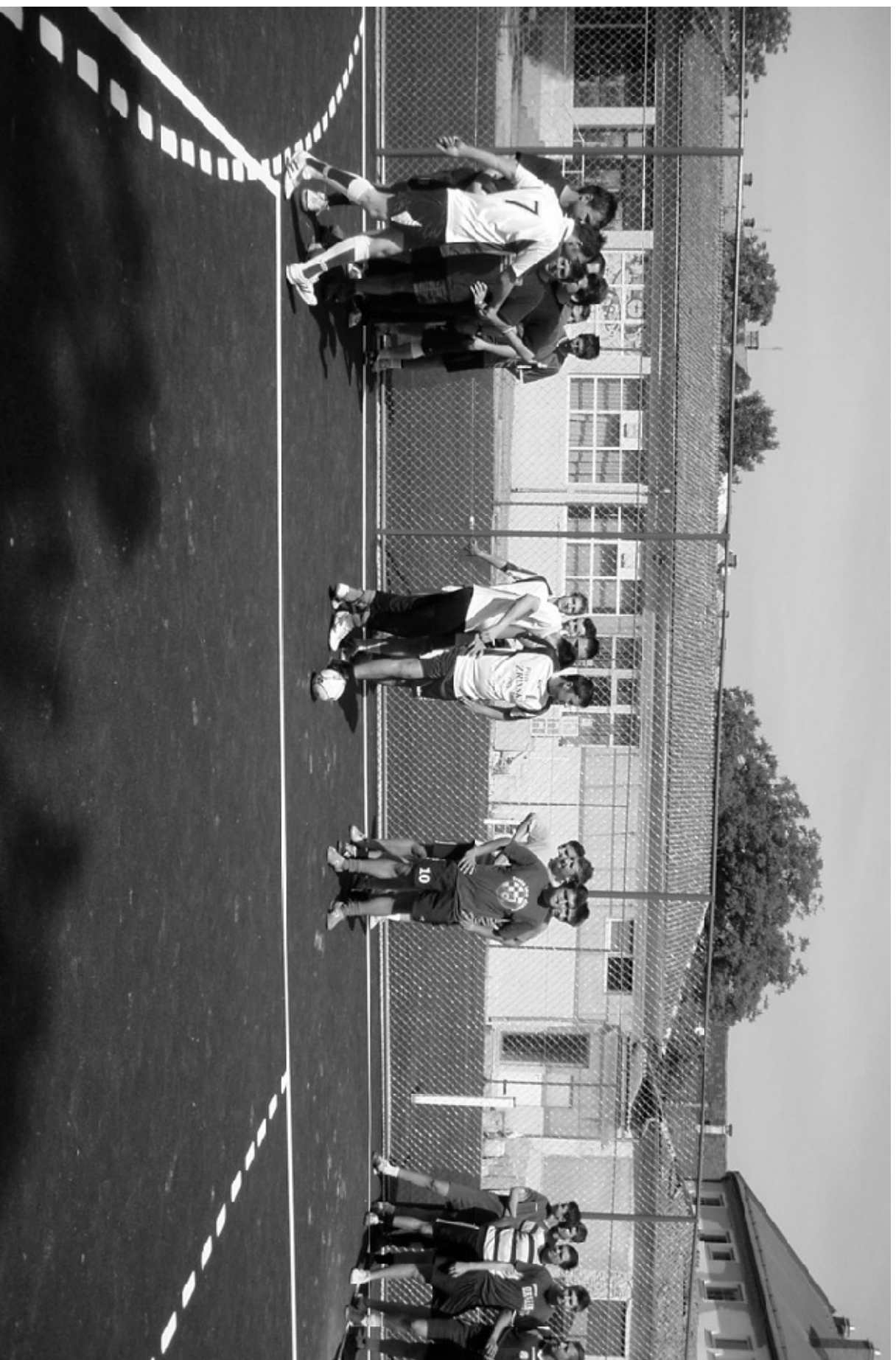
Photo 148. Sport on Polytechnic of Pozeza / Sport na Veleučilištu u Požezi