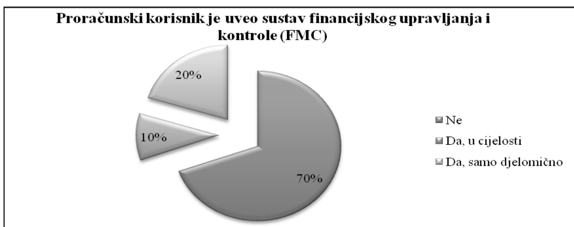
Slika 1. Sustav financijskog upravljanja i kontrole u javnom sektoru

S obzirom na zakonsku obvezu uvođenja sustava financijskog upravljanja i kontrole proračunskih korisnika provedeno je empirijsko istraživanje kojim se htjelo utvrditi trenutno stanje. Istraživanje je provedeno metodom anketiranja javnih menadžera na izabranom uzorku koji čine proračunski korisnici državnog proračuna, kao i proračunski korisnici jedinica lokalne i područne (regionalne) samouprave, obuhvaćeni Registrom korisnika. Rezultati istraživanja temelje se na uzorku od 149 ispitanika. Rezultati pokazuju kako 69,8% ispitanika nije započelo s navedenim procesom, dok 20,1% je započelo i trenutno se nalazi u nekoj od faza uvođenja. Svega 10,1% ispitanika sustav financijskog upravljanja i kontrole uvelo je u cijelosti u skladu sa zakonskom obvezom.