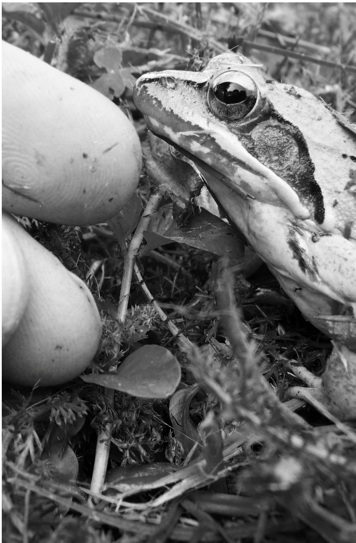
Photo 028. Frog