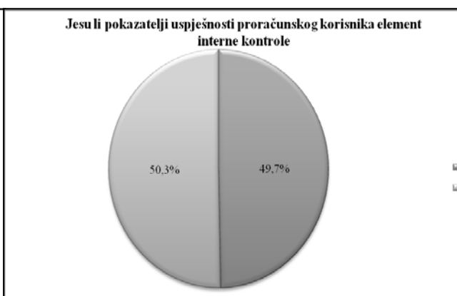
Slika 5. Pokazatelji uspješnosti kao element interne kontrole