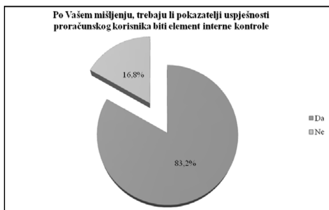
Slika 4. Potreba interne kontrole pokazatelja uspješnosti

Pokazatelji uspješnosti informiraju o uspjehu institucije i razini zadovoljenja javnih potreba stanovništva te prema tome mogu biti izvrstan alat za nadzor uspješnosti poslovanja proračunskih korisnika. Da bi pokazatelji uspješnosti trebali biti element unutarnje kontrole drži 83,2% ispitanih javnih menadžera, dok 16,8% ispitanika smatra da pokazatelje uspješnosti ne treba kontrolirati. Iako 83,2% menadžera smatra kako bi pokazatelji uspješnosti trebali biti kontrolirani od strane internih kontrolora, ovakva kontrola se provodi u svega 49,7% ispitanih subjekata.