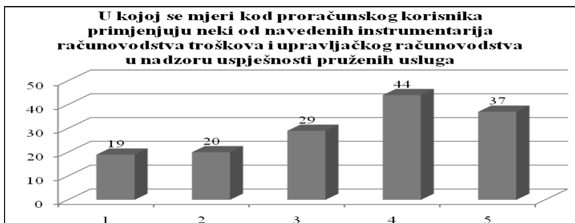
Slika 2. Upravljački alati u funkciji nadzora proračunskih korisnika

Nadalje, istraživala se primjena internih financijskih izvještaja (interni izvještaji o приходima, interni izvještaji o troškovima po mjestima, nositeljima i dr., interni financijski plan, izvještaji o cijenama koštanja usluga, pokazateljima uspješnosti i rezultatima poslovanja) u svrhu nadzora uspješnosti pruženih usluga. Na ljestvici od 1 (ne upotrebljava se) do 5 (upotrebljava se u potpunosti) uporaba upravljačkih alata računovodstva troškova i upravljačkog računovodstva ocjenjena je s prosječnom ocjenom od 3,40.