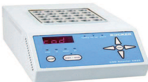
Slika 9. COD reaktor za određivanje KPK

zatvorene kivete COD reaktora, a količina utroška kisika mjeri se spektrofotometrom. Ako je rezultat izvan mjernog područja, potrebno je ponoviti analizu u razrijeđenom uzorku. Rezultat se izražava u mg O 2 /L.