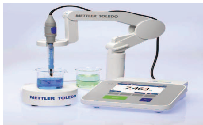
Slika 6. pH metar

nakon toga, uzorkom. Elektroda se tada uroni u čašu s uzorkom, pričekava da se sustav stabilizira i očita pH vrijednost. pH vrijednost se izražava na dvije decimale, uz obavezno navođenje temperature pri kojoj je izvršeno mjerenje. Između dva ili više mjerenja, elektrode se drže uronjene u destiliranu vodu.