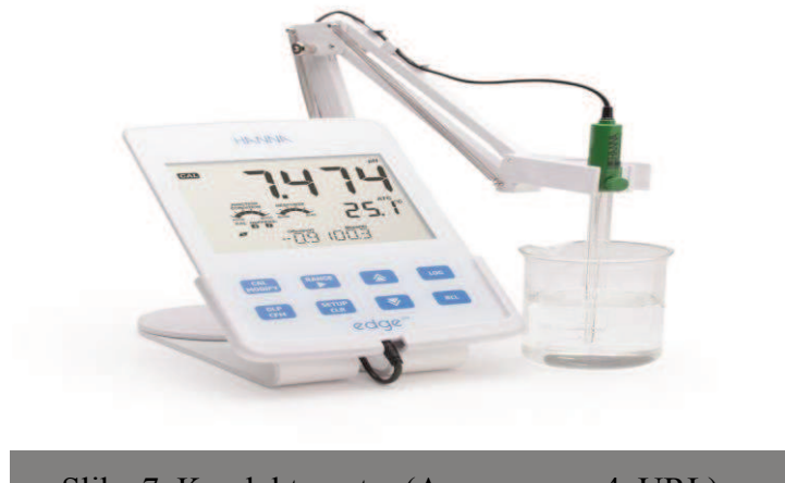
Slika 7. Konduktometar

Električna provodljivost se mjeri pomoću konduktometra. Provodljivost ovisi o prisutnosti ioniziranih i otopljenih tvari u vodi, njihovoj koncentraciji, pokretljivosti i valenciji. Konduktivitet pomaže u određivanju kvalitete slatke vode za različite namjene i vrlo je česti mjereni pokazatelj. Prije početka mjerenja uređaj je potrebno kalibrirati puferom. Za precizno određivanje mjerenje se provode pri temperaturi od 25 °C sa mogućnošću odstupanja od \pm 0,1 °C.